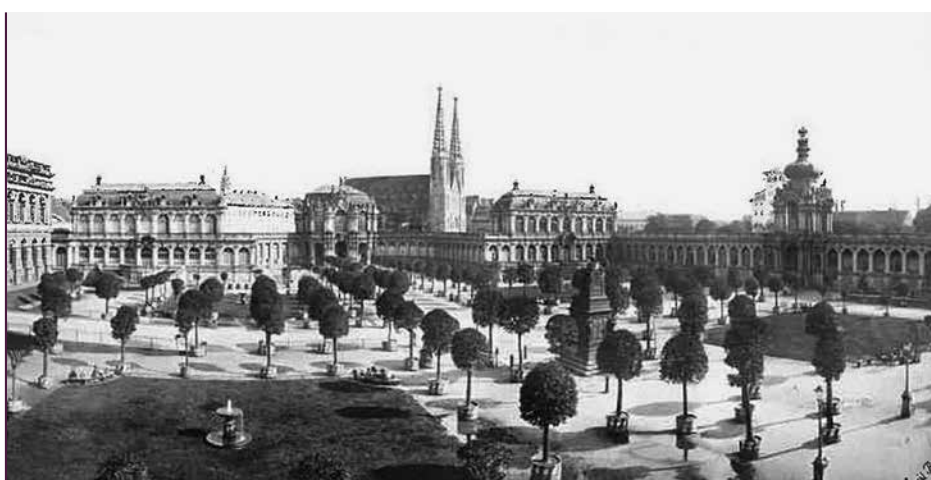
Der Dresdner Zwinger mit Orangenbäumen, um 1880

D ie Orangenbäume träumen sich im Barockgarten Großsedlitz dem Frühjahr entgegen und sind im vergangenen Jahr unter der sorgsamsten Obhut der Orangeure sehr gut gediehen und kultiviert worden. Im April steht der nächste Kronenschnitt an, dann werden die Bäume schick gemacht für ihren Auftritt im Freige-lände.