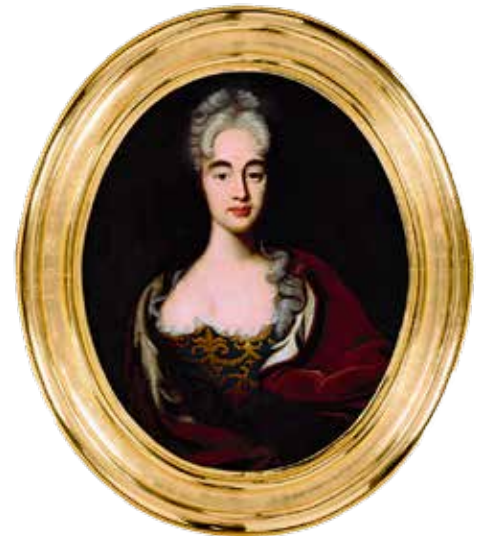
Anna Constantia Gräfin Cosel, Gemälde eines unbekanntes Künstlers, 1715