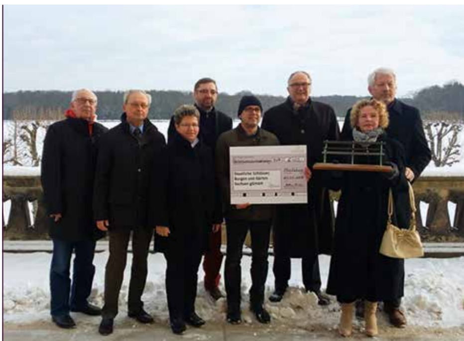
Übergabe des ersten Spendenschecks im winterlich verschneiten Moritzburg