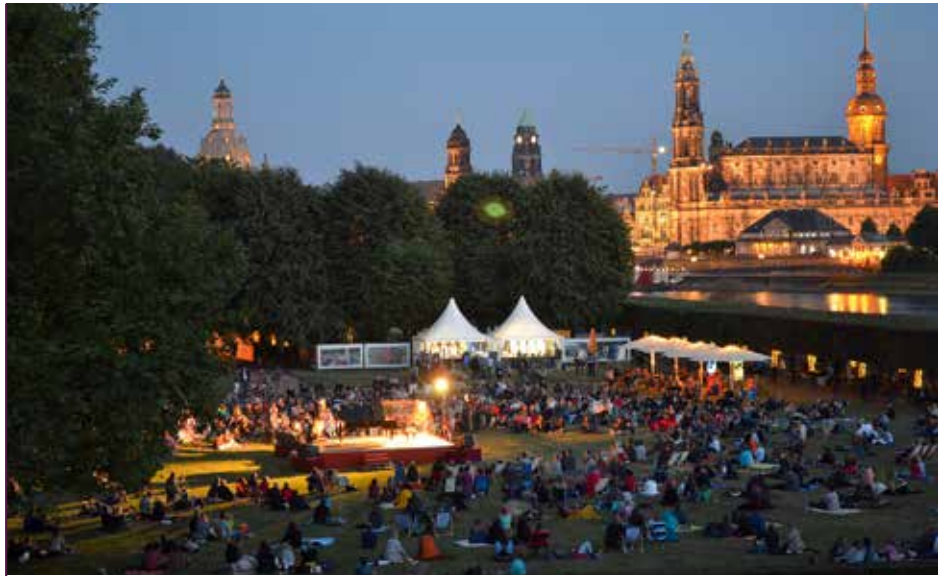
Tausende Dresdner zieht es begeistert im Sommer an die Elbauen unterhalb des Japanischen Palais

Unsere Gesellschaft wird sich weiter entwickeln. Ich versuche an meinem Platz, mich in diesen Prozess konstruktiv einzu-