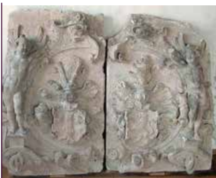
Wappen der Familie von Taube, ehemals über dem Portal des Schlosses