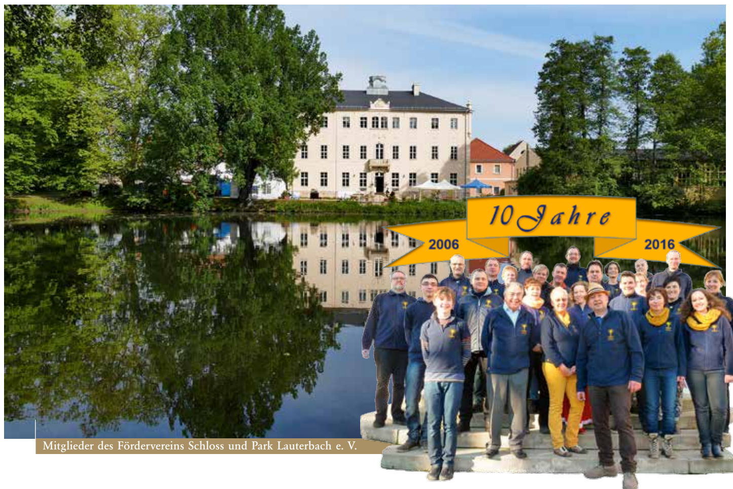
Mitglieder des Fördervereins Schloss und Park Lauterbach e. V.

erste Obergeschoss wird jetzt in Angriff genommen. Das Dachgeschoss harrt noch auf seine Erweckung aus dem Dornröschenschlaf. Die nächste große Etappe bei der Sanierung hat der Verein bereits fest auf seinem Wunschzettel: Das Türmchen. Dieses zierte ehemals das Dach des alten Herrenhauses und musste wegen Baufälligkeit 1931 abgerissen werden. Bei der Sanierung des Daches wurde vorausschauend an seiner Stelle eine Blechhaube installiert, auch Reste der Unterkonstruktion und der alten Turmuhr sind noch vorhanden. Das Denkmalschutzamt hat bereits Unterstützung signalisiert, ob die Deutsche Stiftung Denkmalschutz helfen kann, wird geprüft. Jetzt fehlt dem Verein nur noch das Geld. Das Bauprojekt ist auf Spenden angewiesen. Benötigt werden 70.000 Euro. Mit der Aktion „Werden Sie Turmherr“ wollen die Vereinsmitglieder gegen eine Spende eine „Lauterbacher Turmherrschaft“ vergeben. Einzelheiten erfährt man über die Homepage des Vereins www.schlosspark-lauterbach.de . Die Namen aller Spender sollen öffentlich präsentiert und