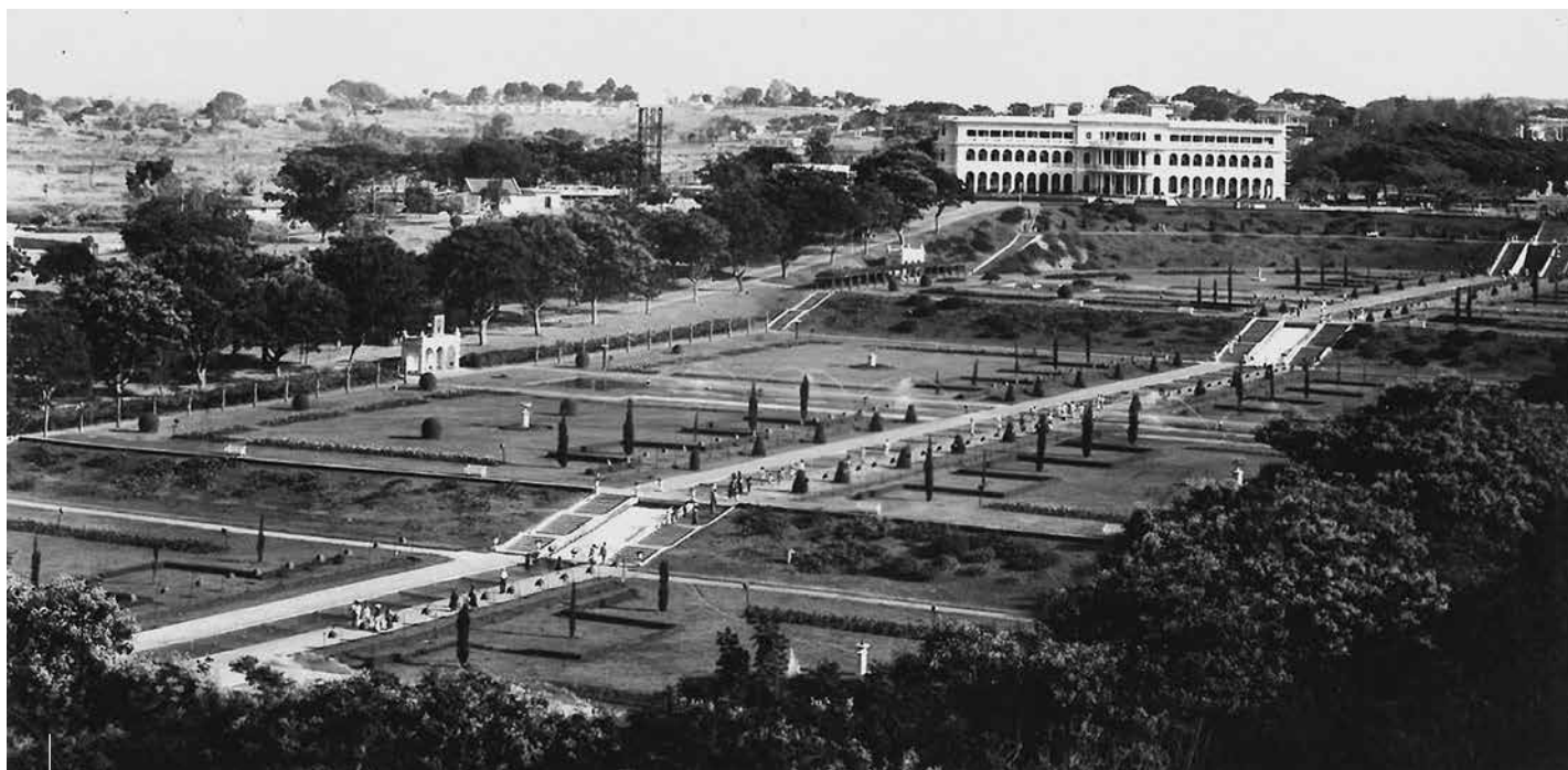
Brindavan Gardens in Bangalore