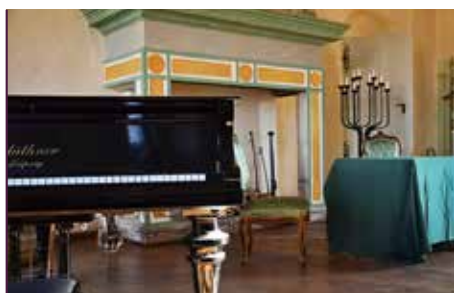
Kaminzimmer auf Schloss Nossen

Die Vorbereitungen Ende 2014 starteten unter dem Arbeitstitel „Intim am Kamin“. Die Kapazitäten im Kaminzimmer des Schlosses sind sehr begrenzt, wodurch jedoch eine heimelige Atmosphäre geschaffen wird, die wesentlich zum Charakter der Veranstaltung beiträgt. Die prominenten Gäste indes spiegeln die breite Palette an künstlerischer Vielfalt in