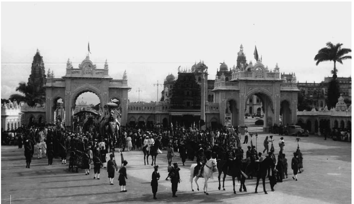
Mysore Palace in Bangalore, um 1900