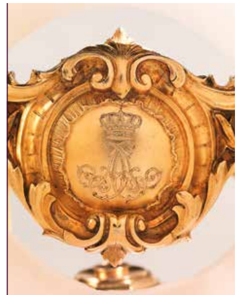
Monogramm König Alberts auf dem Rechaud

dung einzelner Teile und die Geschichte der Dresdener Goldschmiedefamilie Eckert, welche die Vergoldungen ausführte, sind noch weitgehend unbekannt und gilt es in nächster Zeit zu erforschen.