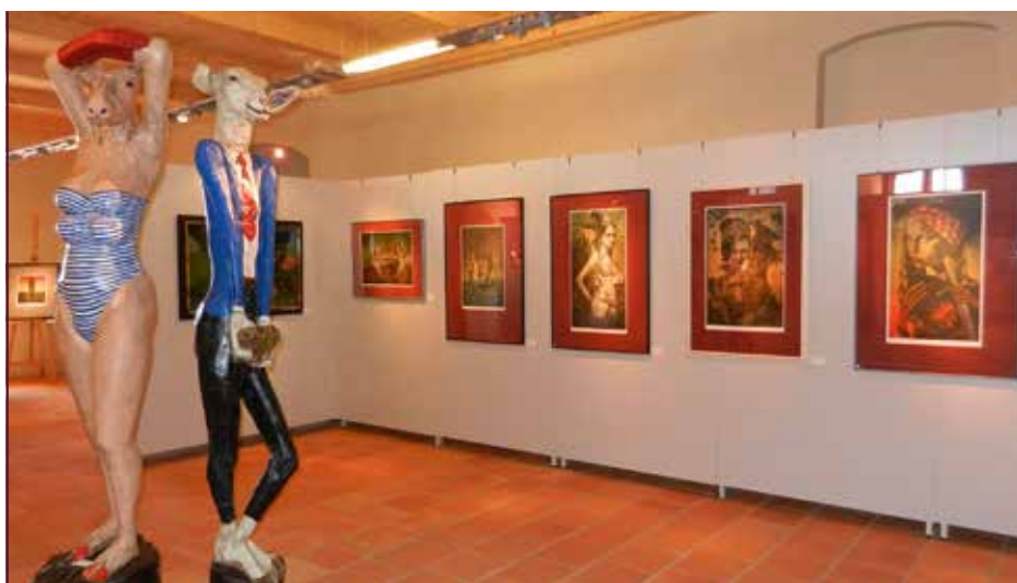
Kunst auf Schloss Voigtsberg