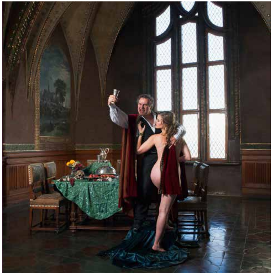
»Jedermann«-Inszenierung auf der Albrechtsburg Meissen

dem Kriminal-Theater Berlin auf dem Burghof zur Aufführung kommen. Ebenfalls neu im Programm ist am Mittwoch, den 22. Juni 2016 die »Spanische Nacht - Lento Amor«, die dem Besucher eine komödiantische und musikalische Reise zum Flamenco verspricht.