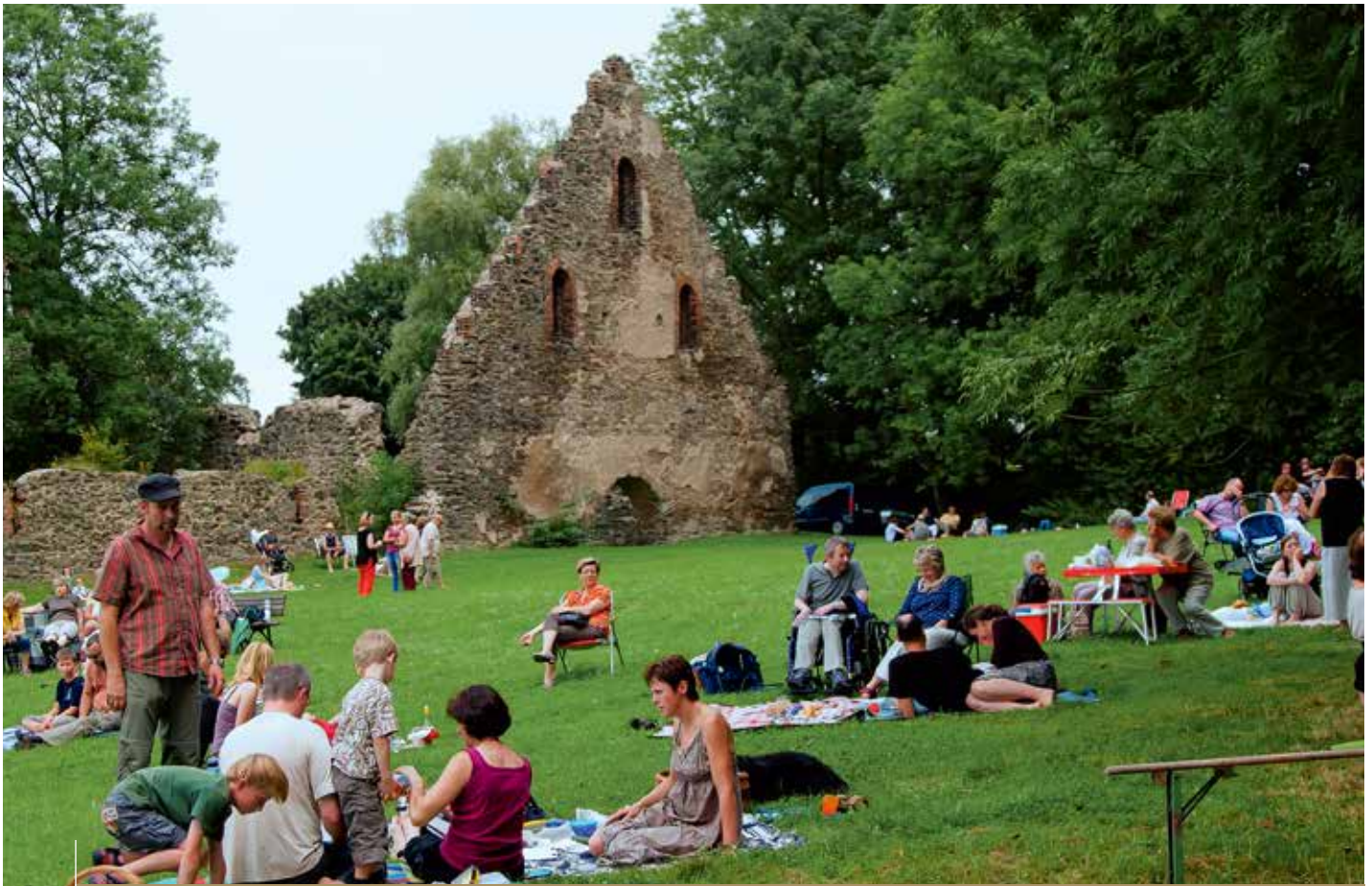
Klosterpicknick in Altzella