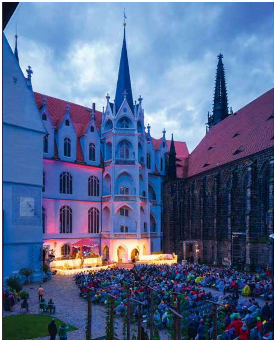
Zu den Neuen Burgfestspielen Meißen kamen im vergangenen Jahr rund 8.000 Besucher