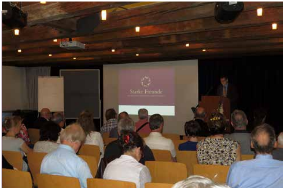
Gemeinsame Diskussion mit Beiträgen aus den drei Arbeitsgruppen

Eine Mitgliedschaft im Verein Schlösserland Sachsen bietet für einen geringen