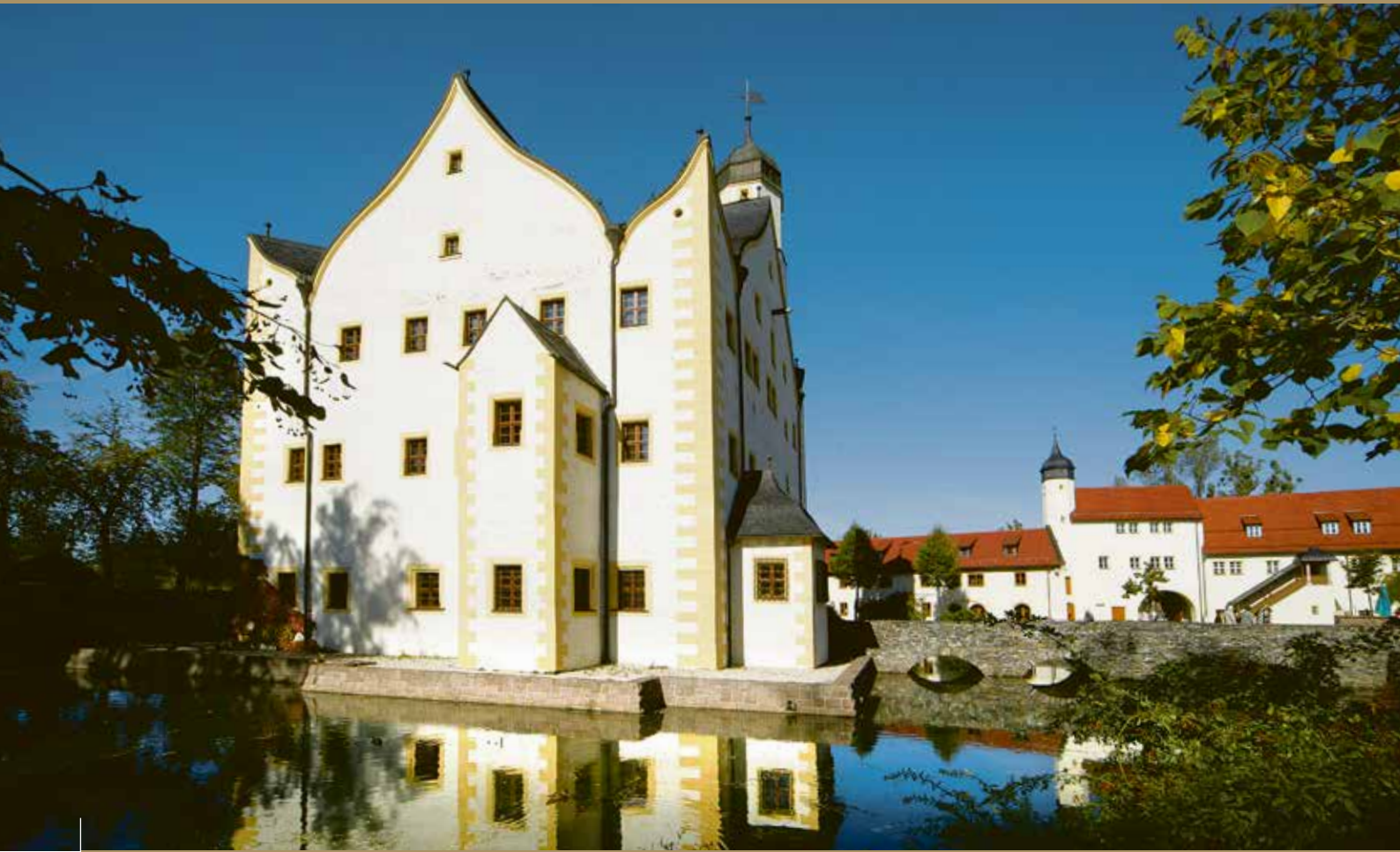
Schloss Klaffenbach (Neukirchen)