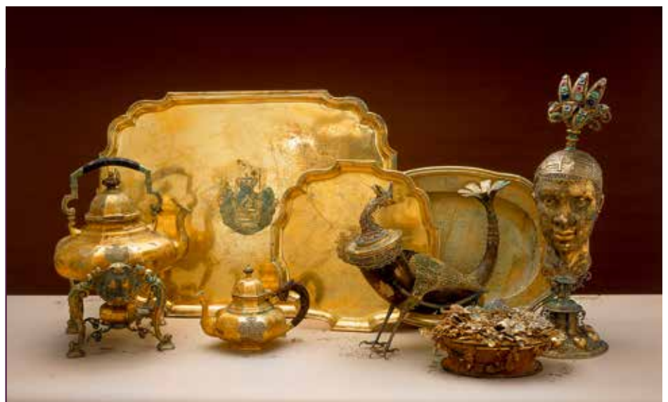
Teile des 1996 entdeckten Wettiner Schatzes