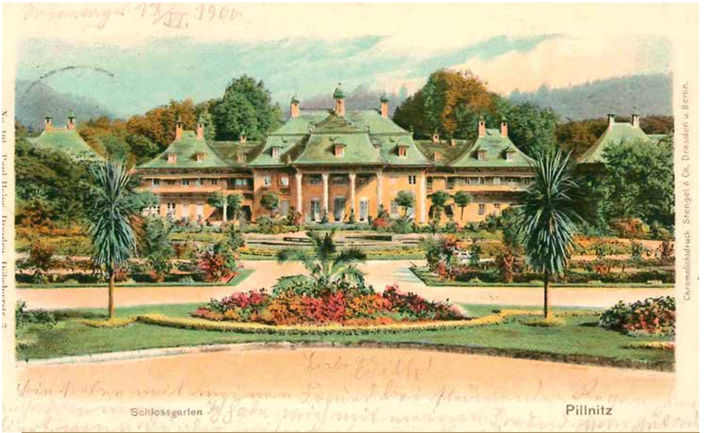
Pillnitz, Teppichbeetpflanzung um 1900