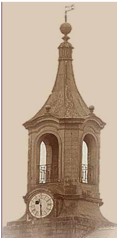
Schlossturm, vor 1931