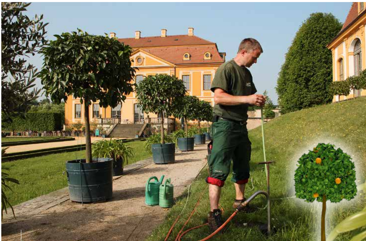
Pflege der Orangenbäume im Barockgarten Großsedlitz