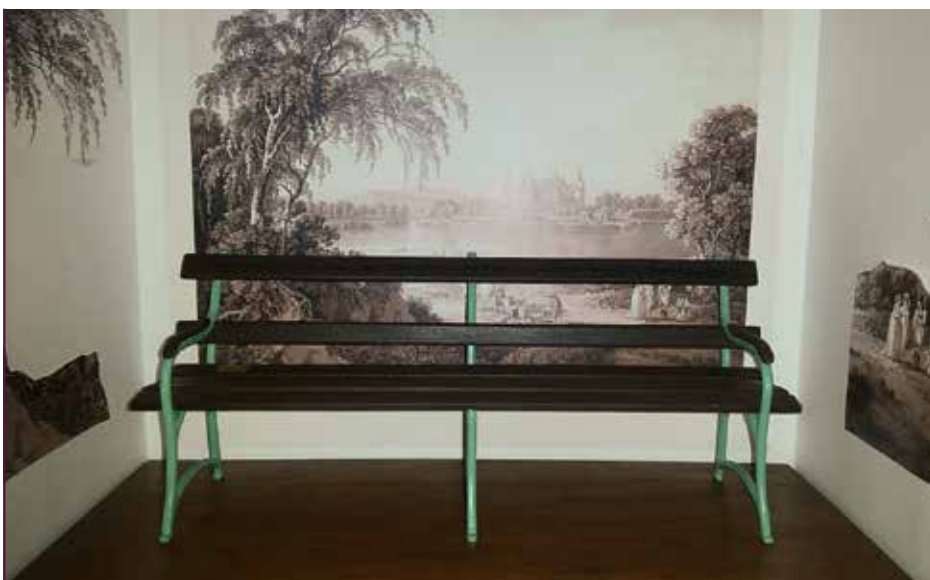
Modell der Parkbank, die nachgebaut und in der Moritzburger Kulturlandschaft aufgestellt wird