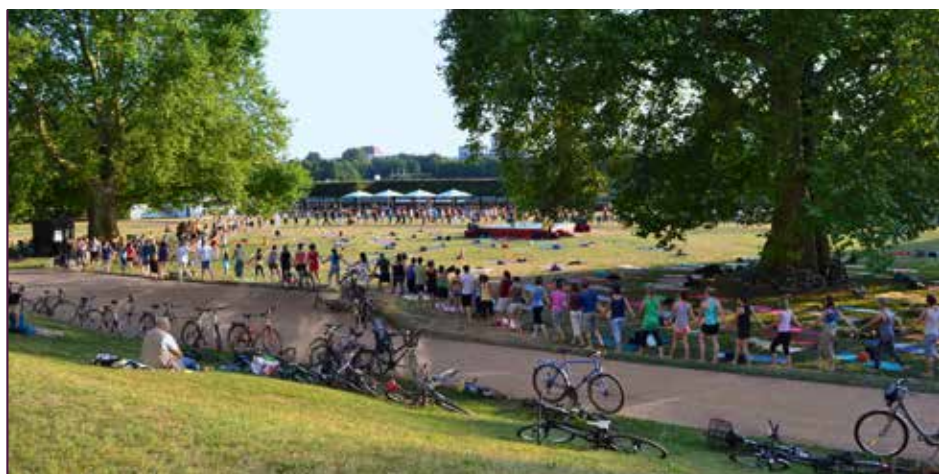
Nicht nur Musik und Malerei, sondern auch Yoga gehört als fester Programmpunkt zum Dresdner Palais Sommer