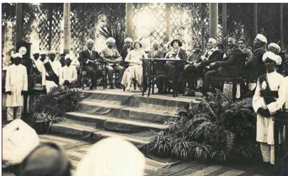
Feierlichkeiten zum Ruhestand Krumbiegels

Anmeldung unter 0351 2613260 oder pillnitz@schloesserland-sachsen.de