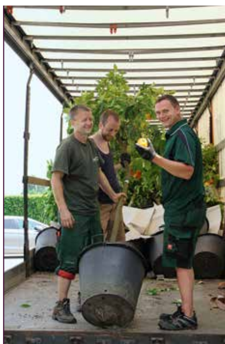
Verladen der Kübelpflanzen für die Aufstellung im Freien

Die Dauer einer Baum-Patenschaft beträgt mindestens 5 Jahre und beläuft sich auf 550 Euro im Jahr. Noch weitere 58 Orangenbäume warten auf einen Paten, damit 2017 die Rückkehr der Orangenbäume gelingen kann. Für die Pflege und Bewirtschaftung der wertvollen aus Italien stammenden Bäume werden jährlich rund 40.000 Euro benötigt.