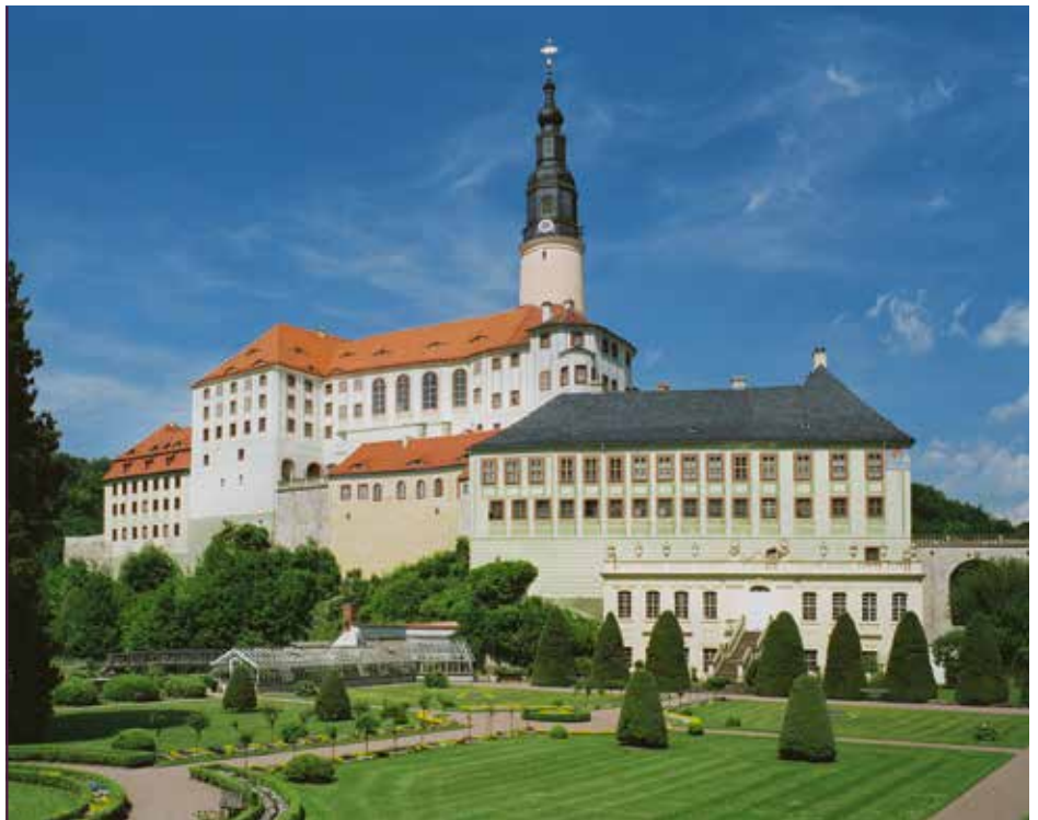
Veranstaltungsort des 1. Sächsischen Schlössertags war Schloss Weesenstein

Strategische Ausgangsbedingung war im Ergebnis der Untersuchungen, dass Sachsen auf eine reiche und vielfältige Kulturlandschaft zurückblickt, die sich über viele Jahrhunderte entwickelt hat. Nach der Wiedervereinigung hatte sich das Land stark für Kultur eingesetzt, was die Identifikation der Sachsen weiter gefördert hat. Generell ist die Kulturfinanzierung der Länder und des Bundes aber rückläufig. Es herrscht in Sachsen, genau wie in den anderen ost-