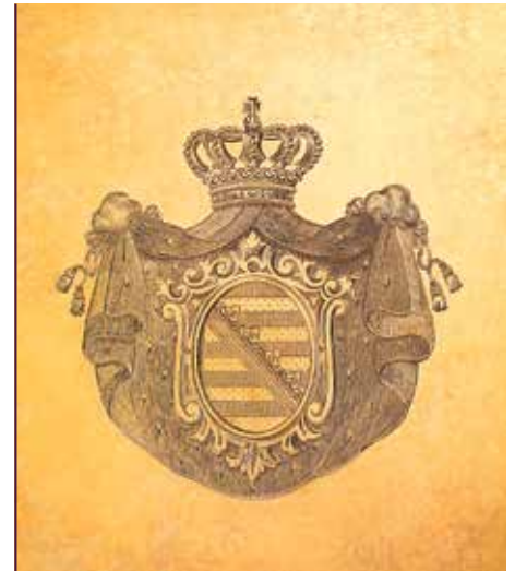
Sächsisches Königswappen auf einer Präsentierplatte

Gebrauchsspuren zeigen, dass es keine Repräsentationsgeschirre waren. Ihre Vorbilder für die Modelle finden sich im Augsburger Barock des 18. Jahrhunderts. Sie sind ein Beleg für das Traditionsbewusstsein der wettinischen Herrscher in Sachsen. Die Umstände der Herstellung wie die konkrete Verwen-