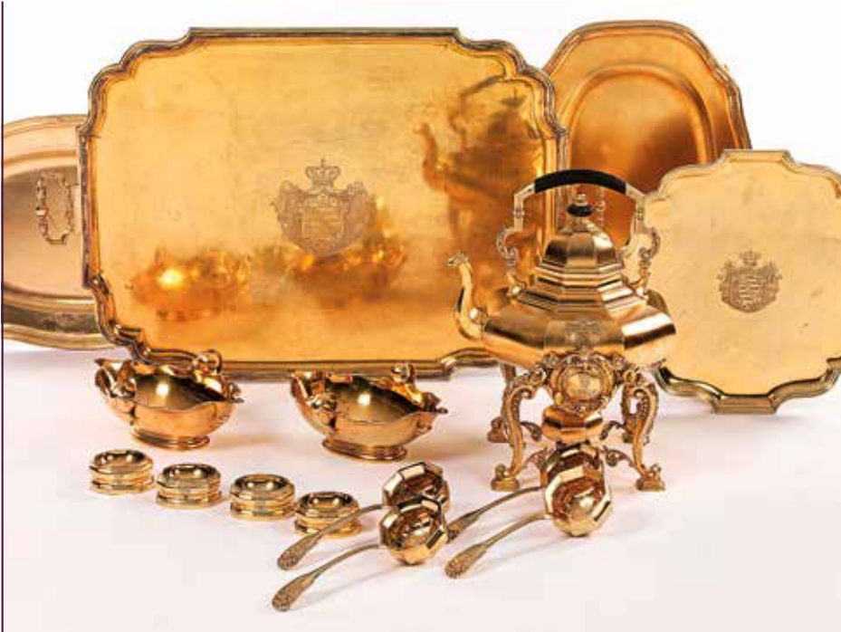
Im März 2015 für Schloss Moritzburg ersteigerte Objekte