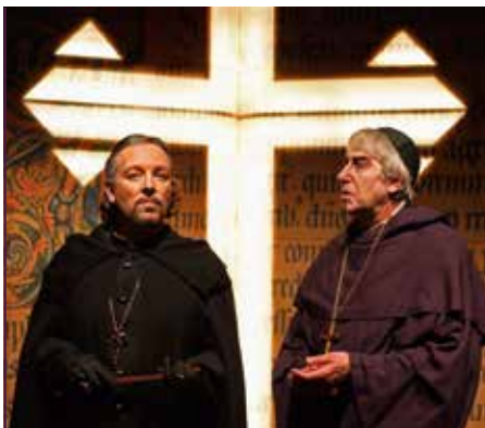
»Der Name der Rose« in Meissen