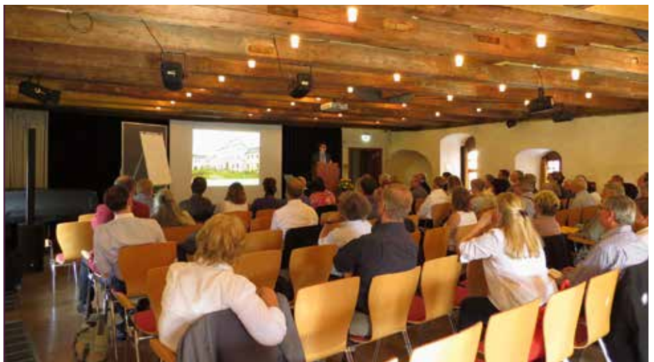
1. Sächsischer Schlössertag auf Schloss Weesenstein