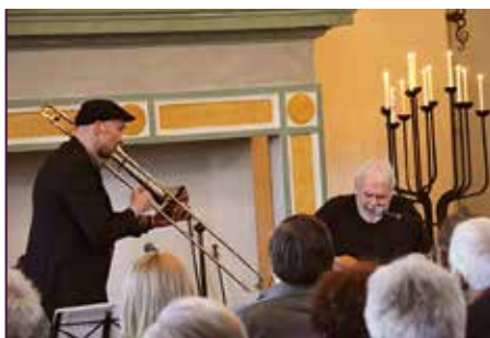
Gunther Emmerlich in Nossen