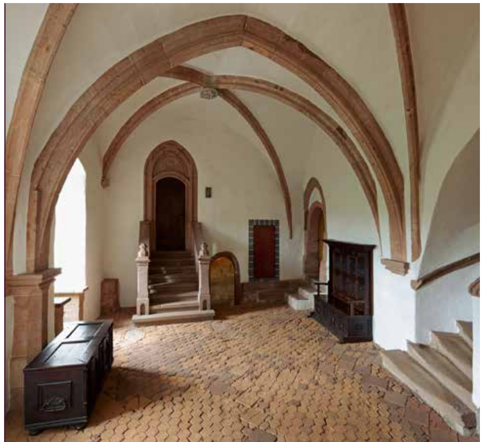
Burg Kriebstein, Gotische Halle