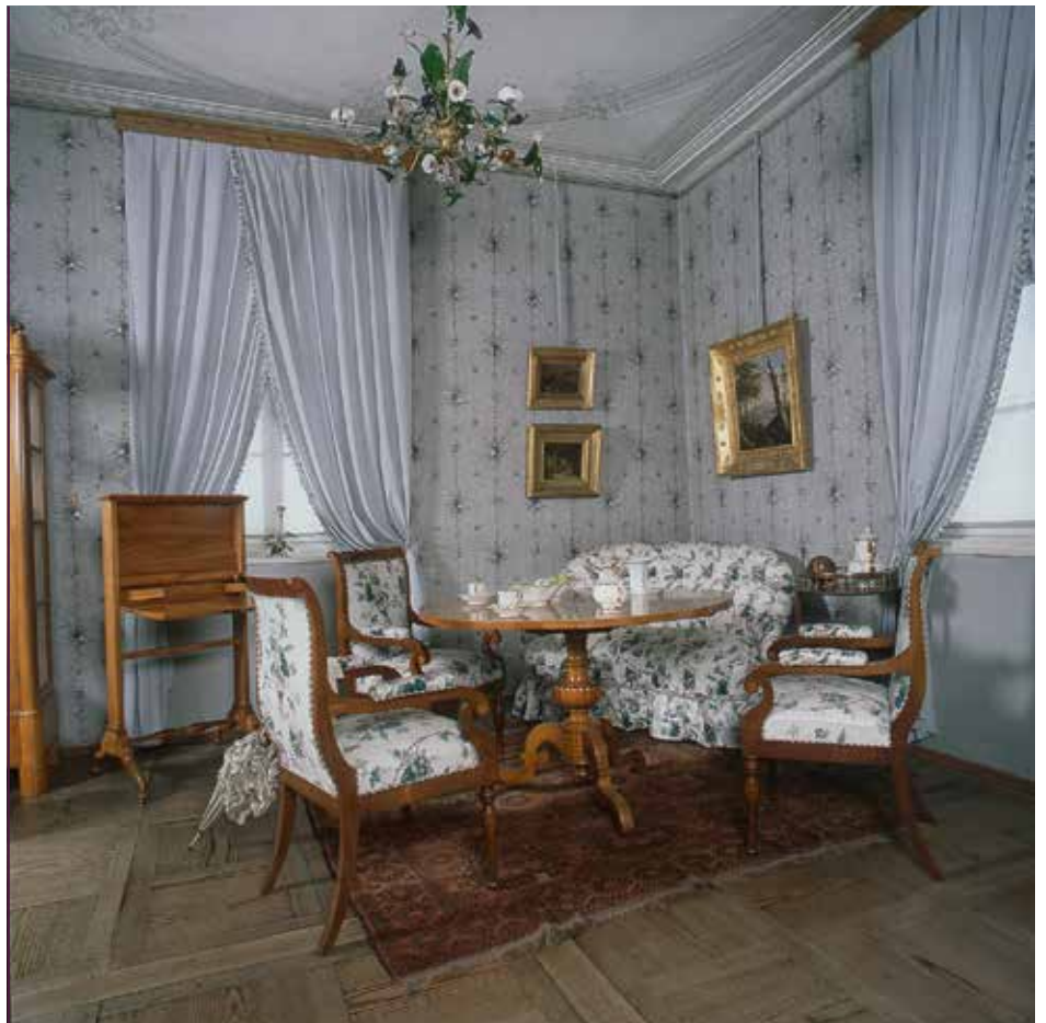
Schloss Weesenstein, Wohnzimmer der Königin Amalie Auguste

Abgesehen von den in Sachsen wie in Böhmen vorhandenen heidnisch und christlich geprägten Bräuchen aus alter Zeit, sind heutige Sitten und Feiertage Tschechiens in Sachsen eher wenig bekannt. Mögen Weihnachtskrippen und böhmischer Glasmusch noch vielen ein Begriff sein, so kennen nur wenige die „pomlázka“, die Osterrute, mit der am Ostermontag traditionell die jungen Mädchen und Frauen ausgepeitscht werden und sie sich dann mit einem Schnaps „revanchieren“. Auch zum Weihnachtsfest wurden die Frauen gepeitscht nach dem Motto „Wer nicht gepeitscht wird, grünt nicht“. Nach dem Frei-