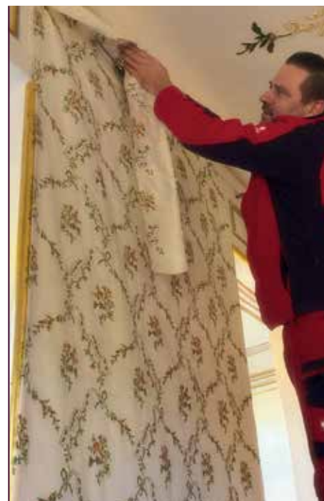
Besfestigung der Stickereitapete