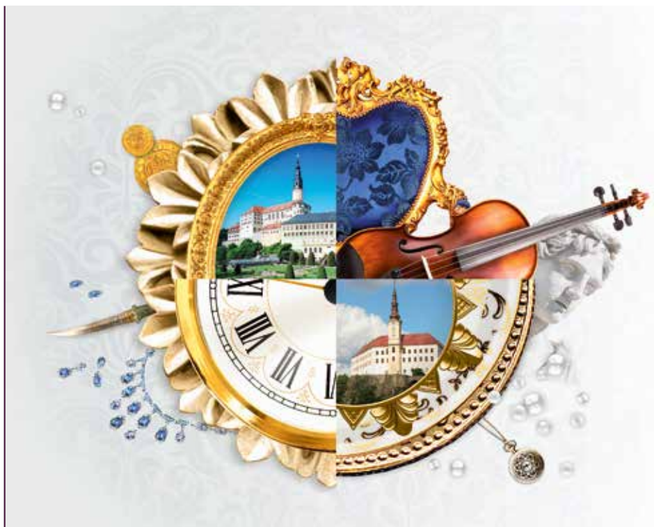
Signet des Projektes „Adelsschätze“ – Die Lust am Sammeln in Sachsen und Böhmen

Ahoj sousede. Hallo Nachbar. Interreg VA / 2014 – 2020