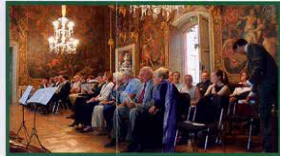
Am 20. Mai 2012 beging der Verein mit einer festlichen Veranstaltung im Schloss das 20-jährige Jubiläum seines Bestehens.

Das Falblatt zeigt eine Auswahl. Für die einzelnen Objekte wurden jeweils bis zu fünfstelligen Beträge aufgewandt.