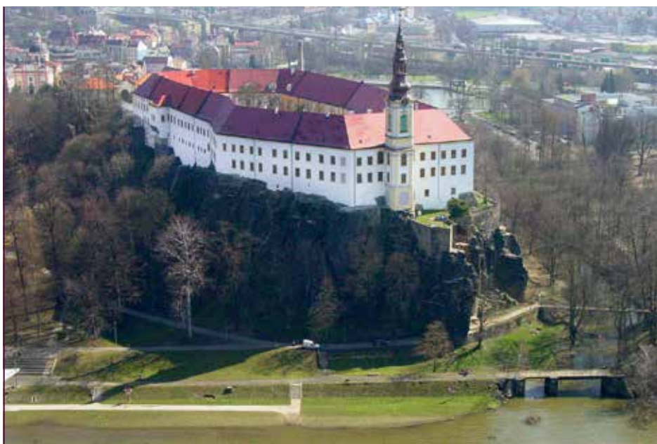
Schloss Tetschen (Děčín) in Nordböhmen

Sammlungen entstanden aus Repräsentationsbedürfnis und Prestige, aber oft auch aus Leidenschaft und Sammelwut. Oft machte sich der Schenkende Gedanken um die Vorlieben des Empfängers – so wie auch heute noch zuweilen beim Austausch von Staatsgeschenken üblich, obwohl die Geschenke nach der Übergabe in Depots oder der Asservatenkammer gelagert werden. Selbst Geschenke mit persönlichem Charakter, z.B. Schmuck für die „First Lady“, verbleiben in Staatsbesitz. Geht es heute eher um die Demonstration guter Beziehungen zwischen Staaten, waren früher neben freundschaftlichen Gesten auch politische Erwartungen mit einem Geschenk verbunden und manchmal demonstrierten Geschenke auch einen Herrschaftsanspruch.