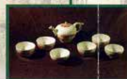
Teile aus einem Teeservice „Roter Drache“ 1740/50 aus der Hofkonditorei Augusts III.