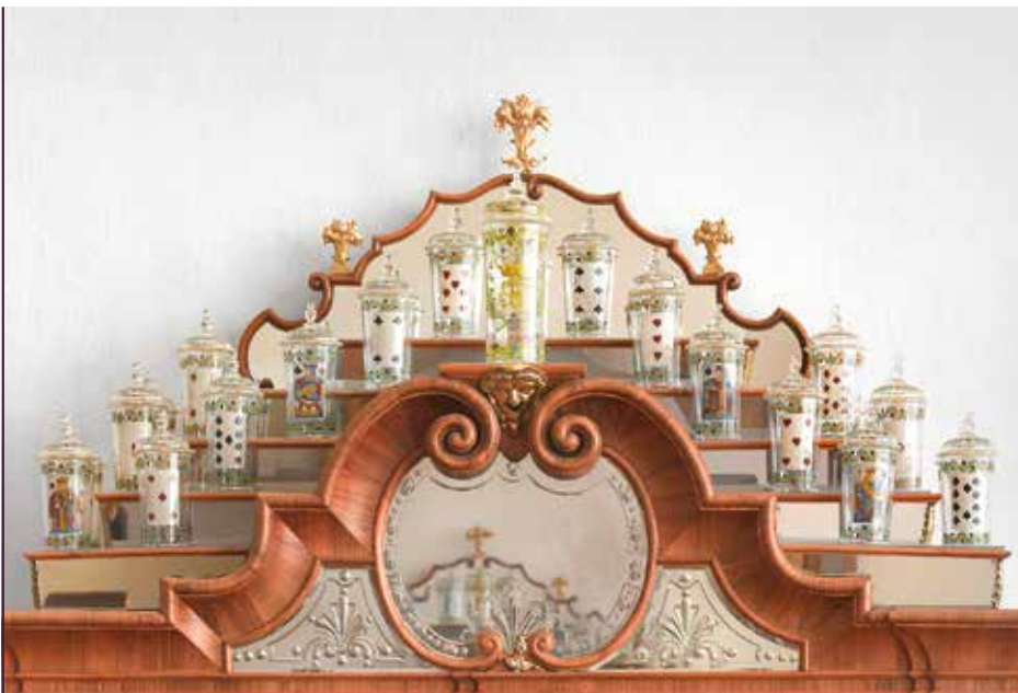
Originalgetreue Kopien historischer sächsischer Trinkgläser („Spielkartengläser“)

originalgetreu von einer darauf spezialisierten böhmischen Firma anfertigen zu lassen. Diese sogenannten „Spielkartengläser“ zieren heute wieder wie schon bis 1945 die zugehörigen Aufsatzschränke des Festsaaes. Neben Ankäufen finanziert der Verein auch Restaurierungen: so das eines historischen Jagdgemäldes aus dem 17. Jahrhundert, des textilen Totenschildes von Kurfürst Johann