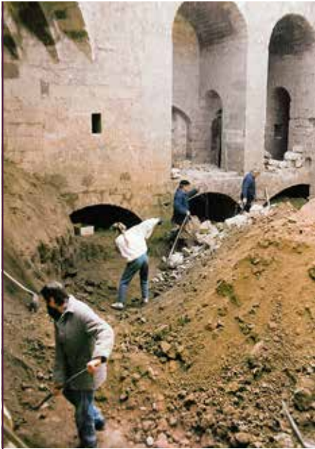
Ausgrabung des Großen Flankenhofs der Festung Dresden, 1991