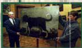
Restauriertes „Porträt eines Jagdhundes“, 17. Jh., unbek. dt. Maler