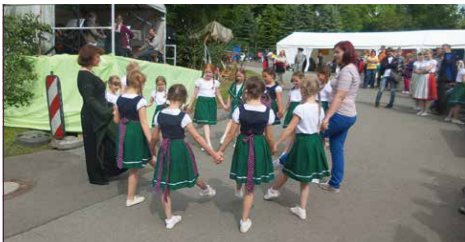
Kindertanzgruppe zum Jubiläum „450 Jahre Lotterhof“, 2016