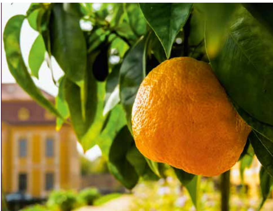
Die Orangenbäume tragen erste Früchte.