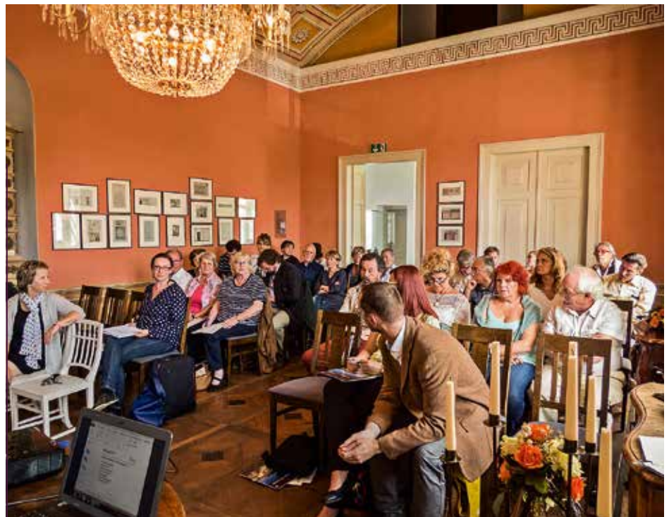
Teilnehmer des Schössertags bei der Diskussion