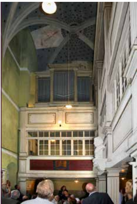
Besichtigung der Schlosskapelle mit der Orgel, die ihre klingenden Pfeifen zurückerhalten soll

Der Mitgliederversammlung war ein Treffen des Vorstands mit den aktiven Mitgliedern der vier Beiräte vorausgegangen. Dabei sprachen die Beiratsmitglieder über ihre Aufgaben und Projekte und baten um bessere Kommunikation mit dem Vorstand. Alle waren sich einig, solche Treffen in größerer Runde öfter stattfinden zu lassen.