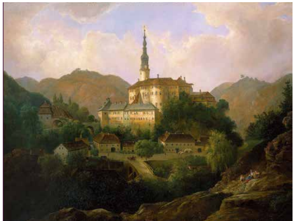
Schloss Weesenstein, Gemälde von Franz Wilhelm Leuteritz, 1876