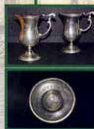
Zinnkannen aus der ehemaligen Hofküche Moritzburg