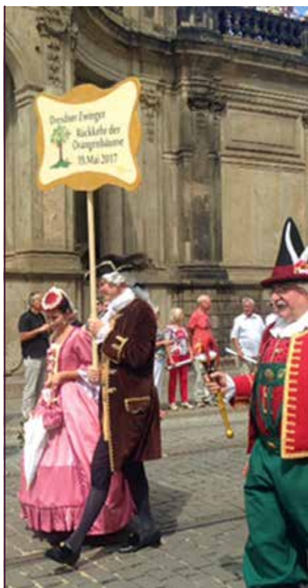
Der Verein Barock in Dresden e. V., unser Mitglied und Pate eines Orangenbaums, unterstützt das Spendenprojekt beim Umzug des Dresdner Stadtfestes am 21. August 2016.