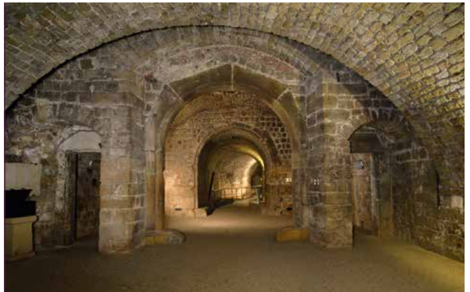
Festung Dresden, überbautes Ziegeltor

Sachsen das Festungsmuseum an allen Tagen der Woche geöffnet ist, konnten sich viele Tausende Besucher von der einstigen Wehrhaftigkeit der Stadt Dresden überzeugen. Seit 1993 – jegliche Grabungstätigkeit wurde zu diesem Zeitpunkt behördlicherseits untersagt – regelt ein langfristig angelegter Vertrag die Beziehungen des Vereins zum Eigentümer der Kasematten. Der Vertrag beinhaltet außerdem die Nutzung der Räumlichkeiten der Piatta Forma, eines