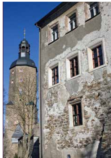
Impression aus Geyer

Im Frühjahr 2010 können die frisch sanierten Gewölbe erstmals vermietet werden. Seitdem erfüllen Konzerte, kulturhistorische Vorträge, Schlemmerabende, Weinverkostungen, Klassentreffen und Familienfeiern den Lotterhof mit Leben und tragen einiges zum Erhalt und seiner weiteren Sanierung bei. Bis zu 60 Personen können in den drei Kreuzgratgewölben im Erdgeschoss feiern, durch den Einbau von Öfen auch in der kalten Jahreszeit. Besonders stolz ist der