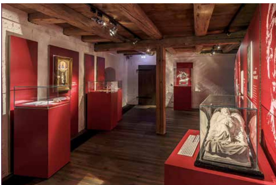
Blick in die Sonderausstellung „Verschenkt“

Von Erzherzog Ferdinand, seinem Nachbarn an der südlichen Landesgrenze, erhielt er damals einen Harnisch und sein Sohn, der spätere Kurfürst Christian I., erhielt von Kaiser Maximilian II. aus Prag sogar