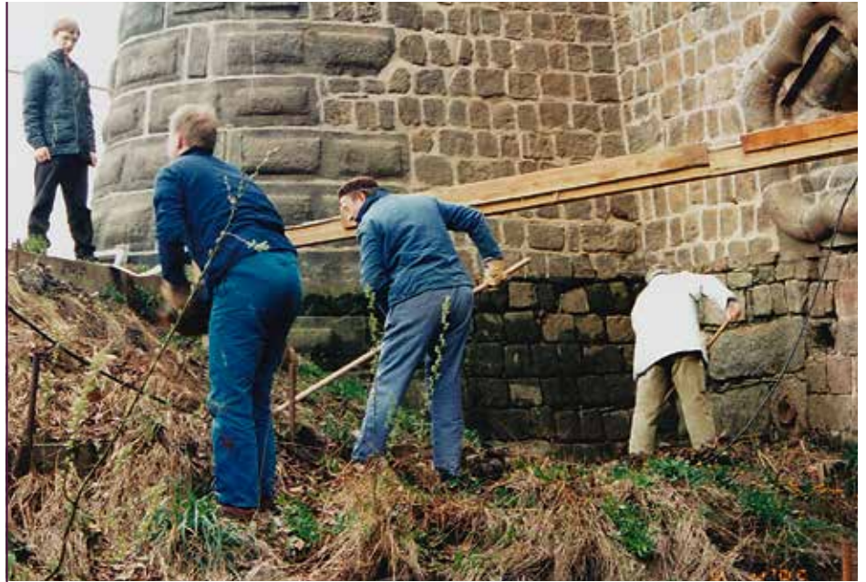
Ausgrabung des Bastionskanals, 1995