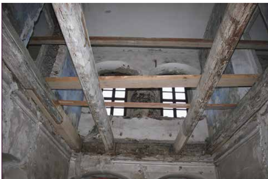
Baustelle im Lotterhof

Eine kleine Ausstellung im ersten Obergeschoss zeigt Funde, wie Scherben, Nägel und Knochen, die beim Abbruch der alten Fußböden gefunden wurden. Vom Interieur sei leider nichts geblieben, bedauert Stoll. In Geyer haben über die Jahrhunderte mehrere Stadtbrände gewütet und wahrscheinlich auch im Lotterhaus ihren Tribut gefordert. Einige Teile der Originalbalken aus dem Baujahr 1566 sind jedoch erhalten. Sie wurden erst kürzlich bei der Sanierung der Decken aufgefunden. Reste von farbigen Wandmalereien und fein gearbeiteten Türstürzen zeugen von wohlhabenden Bewohnern. Eine Holzkassettendecke aus der