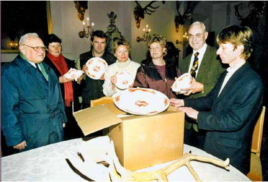
Moritzburger Schlossfreunde beim Auspacken des Speiseservices „Königlicher Roter Hofdrache“, 2002