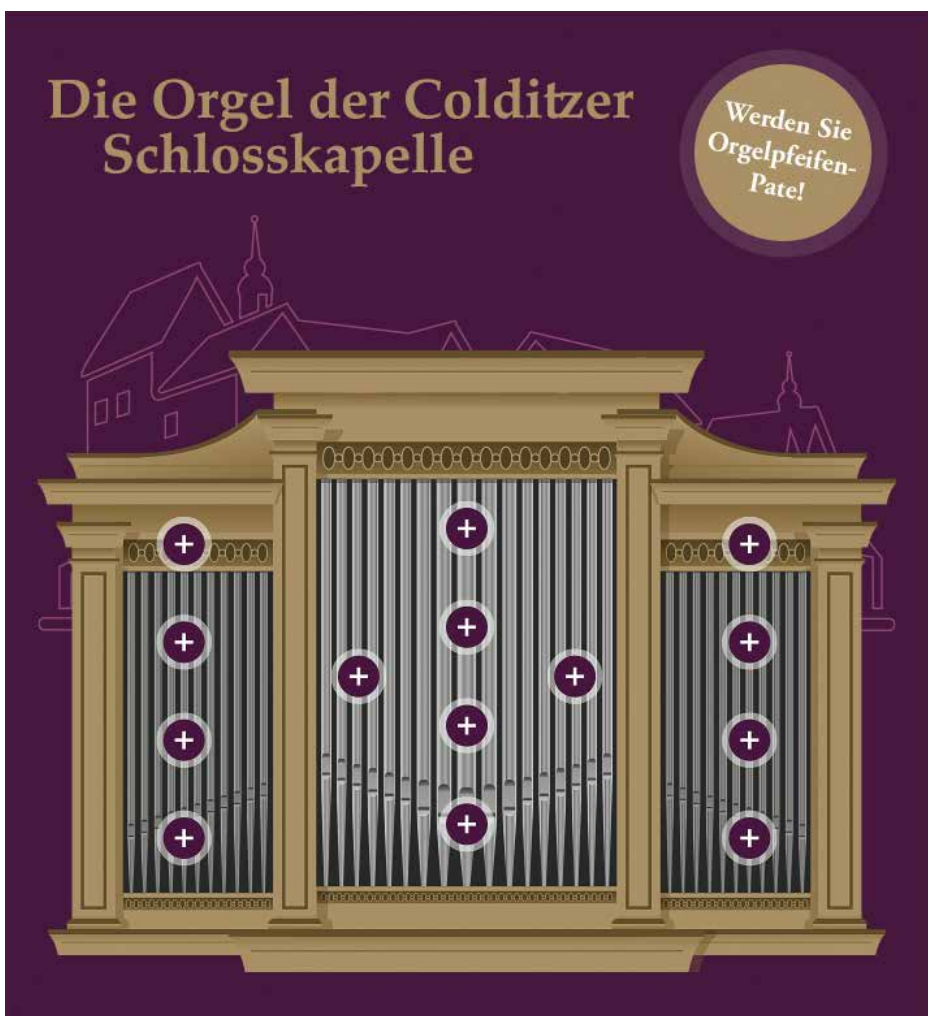
Visualisierung der Orgel auf der Internetseite des Freundeskreises Schlösserland Sachsen