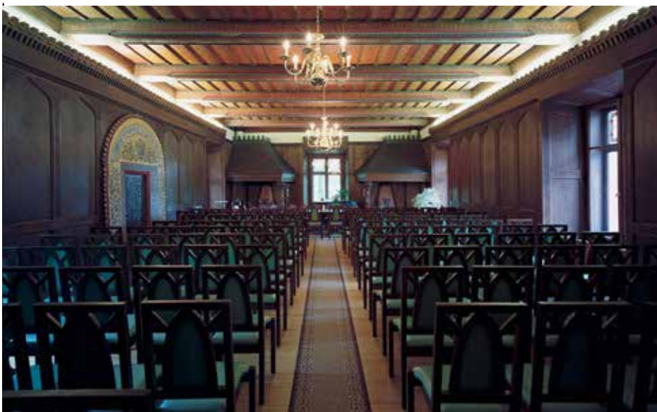
Schloss Schlettau, Festsaal