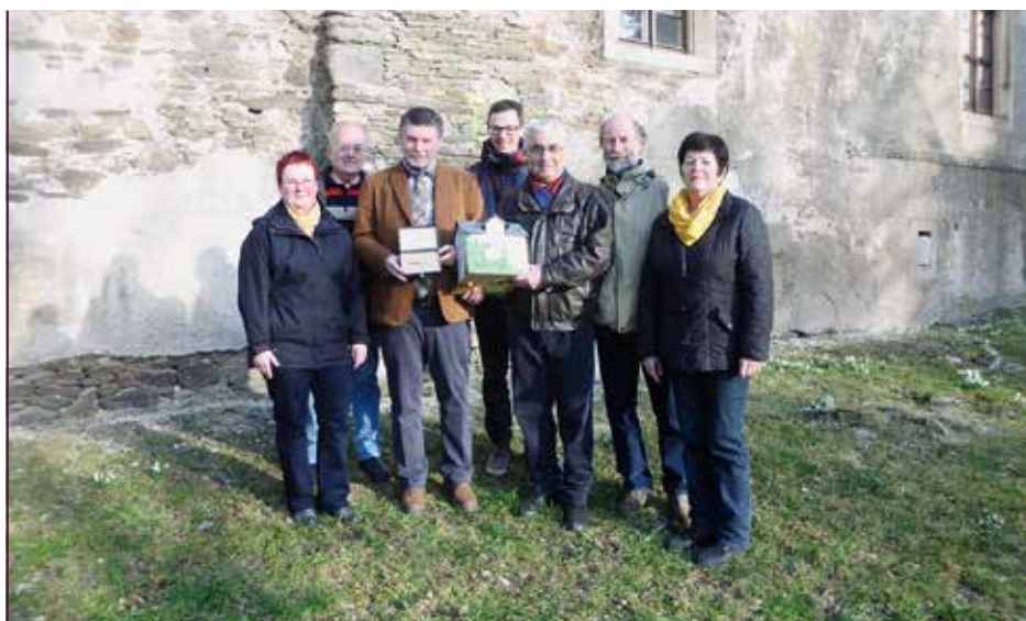
Bürgermeister und Vereinsmitglieder mit einem „Spendenhaus“ vor dem Lotterhof

Als erstes ist die Statik dran, Risse im Gemäuer werden geschlossen, Anker gesetzt. Auch für 2016 steht noch einiges auf der Agenda des Vereins: Nach der Schaffung eines neuen Portals sollen im Herbst mehrere Fassadenteile verputzt werden. Der alte Kohlebunker soll abgerissen, die Abdichtung des Hauses und seine Trockenlegung angegangen werden. Das Gelände ist stark abschüssig, bei Regen drängt Wasser ins Gebäude. Zum Hochwasser 2013 standen die Fluten in den Gewölben des Erdgeschosses. Inzwischen sind seit 2007 rund 700.000 Euro in das Objekt investiert. Sein unmittelbarer Verfall ist gestoppt. Auch wenn noch viele Aufgaben bleiben, aufgrund des Engagements vieler Ehrenamtlicher hat der 450 Jahre alte Lotterhof eine Zukunft.