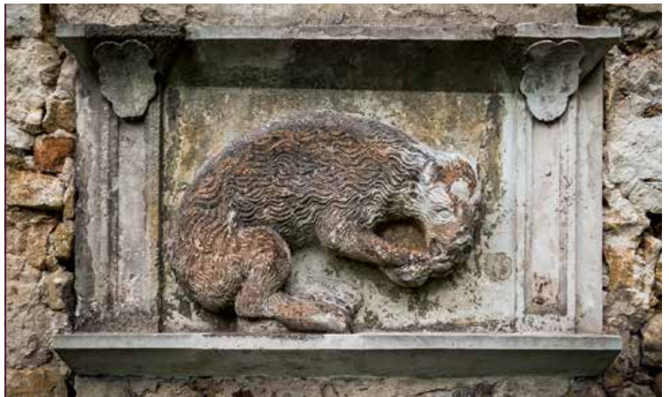
Schloss Struppen. Ein Bär erinnert an die Familie von Bernstein aus Bärenstein

Auf der Grundlage des aktuellen Nutzungskonzepts des Vereins für die bauliche Entwicklung des Schlosses zu seiner Nutzung erfolgte 2015/2016 die Entwurfsplanung als Grundlage für die Einreichung des Bauantra-