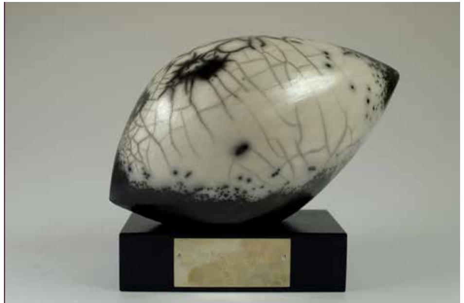
„Das Brechen des Eises“, Keramik, Geschenk des Präsidenten der Republik Island 2013

Schätze aus Prag heute in Wien, Dresden und aller Welt bewundert werden können, blieben die wettinischen Sammlungen zu einem großen Teil in Dresdner Museen.