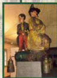
„Moritzburger Chinese“, Rückerwerb