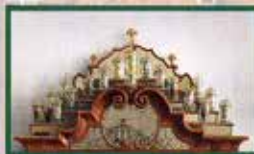
Originalgetreue Kopien historischer sächsischer Trinkgläser („Spielkartengläser“)