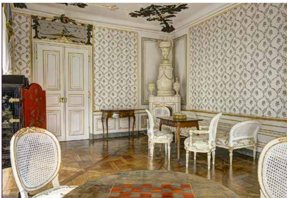
Fasanenschlösschen, Antichambre mit Seidentapeten

Der Entschluss, dem Antichambre seinen einstigen Seidenglanz zurückzugeben, war nur folgerichtig, nachdem der farbige Deckenstück und die weiß-gold gefassten Holzlambries restauriert worden waren, sowie bereits alle anderen Zimmer des Fasanenschlösschens wieder in alter Pracht erstrahlten. Doch welche Tapete sollte der Raum bekommen? Die Suche nach geeigneten Tapetenvorbildern erstreckte sich über ganz Europa: in Schlössern und Textilmuseen wurden nach ebensolchen Tambour-