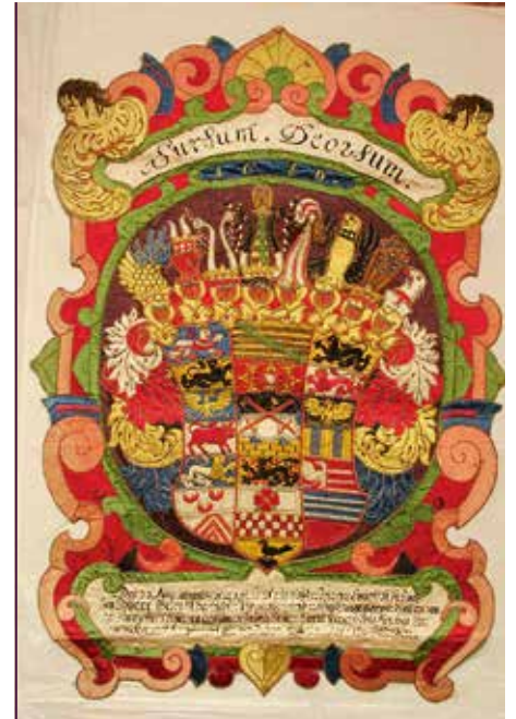
Textiler Totenschild für Kurfürst Johann Georg II., 1680, restauriert durch die Hilfe der Schlossfreunde