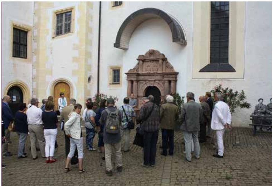
Mitglieder des Freundeskreises Schlösserland Sachsen vor der Colditzer Schlosskapelle