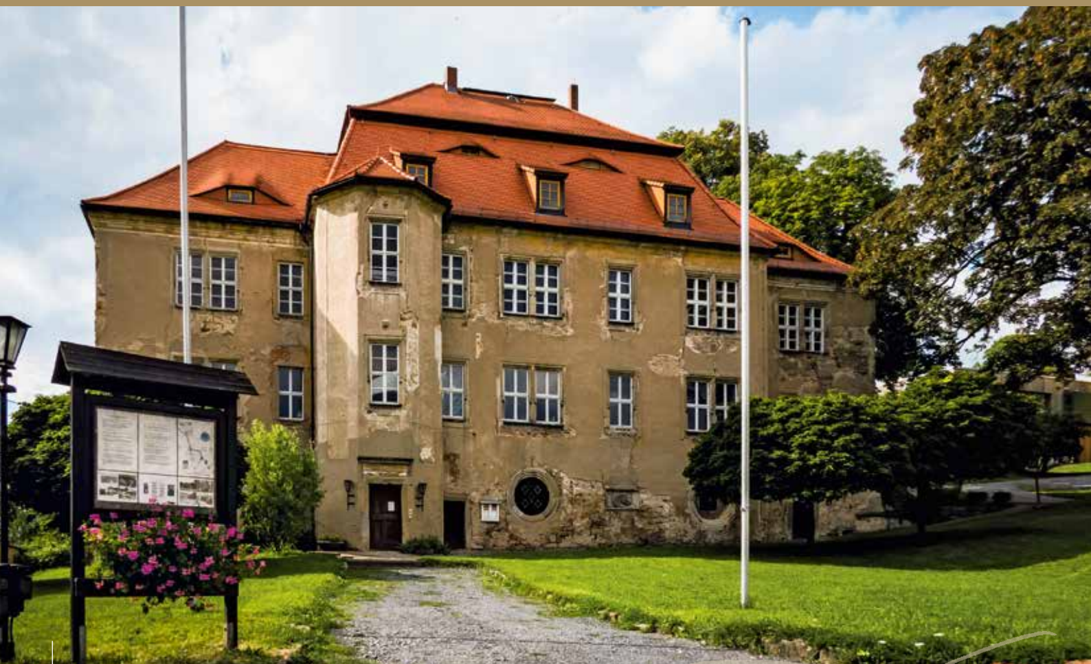
Schloss Struppen, 2016