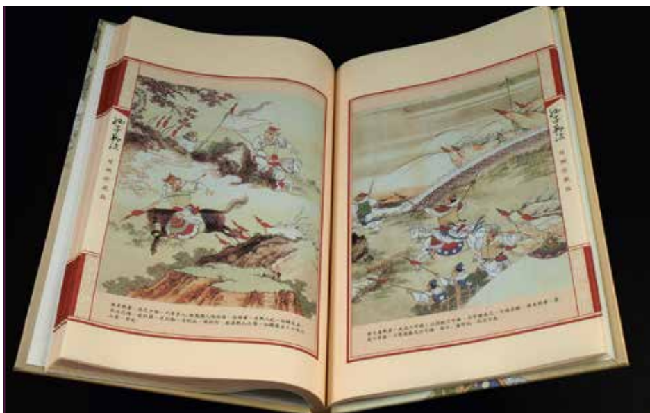
„Die Kunst des Krieges“, bedruckte Seide, Geschenk des Vizegouverneurs der Provinz Hubei (China) 2015

In einem weiteren Meilenstein werden wir in Weesenstein 2017 einen sehr prominenten Sammler vorstellen: Prinz Johann Georg (1869–1938), einen Bruder des letzten sächsischen Königs. Als Zweitgeborenem fielen ihm nicht nur die im Familienbesitz befindlichen Sammlungen – etwa Bibliotheken und Gemälde – zu, sondern auch das Schloss Weesenstein, da sein Vater Georg den sächsischen Thron bestieg. Zugleich war er der letzte wettinische Schlossbesitzer. 1917 verkaufte er Johanns Refugium an einen bürgerlichen Fabrikanten. Er selbst ließ sich in Freiburg im Breisgau nieder. Wie viele Adelige um die Jahrhundertwende bereiste Johann Georg andere Kontinente: 1910 führte ihn eine dreimonatige Reise nach Syrien, Palästina, Ägypten und in den Libanon, 1912 erneut nach Ägypten. In Ägypten und im Orient erweckte vor allem koptische, ägyptische und griechische Kunst sein Interesse. Für Johann Georgs Sammlung interessierte