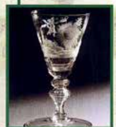
Pokal mit Vergöttlichung Augusts des Starken

Freunde des Museums Schloss Moritzburg 1991 bis 2016