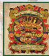
Restauriertes Totenschild des Kurfürsten Johann Georg II. von Sachsen