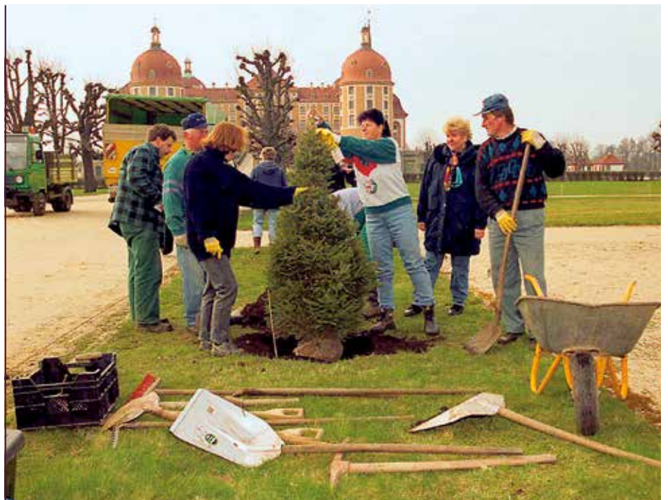
Baumpflanzung der Moritzburger Schlossfreunde im Schlossgarten, 2000

Eines der ersten Projekte des Vereins war die Wiederherstellung des Schlossparks in seiner ursprünglich geplanten Form. Dazu wurden zwei Baumpflanzaktionen mit vier Kastanien und 60 Rotfichten, finanziert aus Spenden, durchgeführt. Weitere größere Aktionen waren die finanzielle