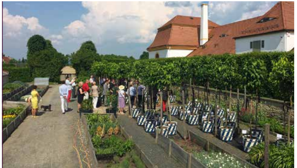
Die Paten besuchen am 5. Juni 2016 die 80 Orangenbäume für den Dresdner Zwinger.

Wir danken allen Helfern und Paten, die dazu beitragen, barocke Gartenkunst und Festkultur wieder mit Leben zu erfüllen.