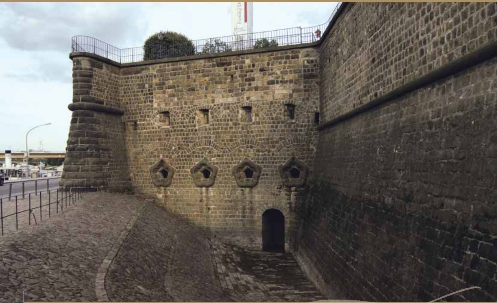
Brühlsche Terrasse in Dresden, Reste der Festungsanlage des 16. Jahrhunderts