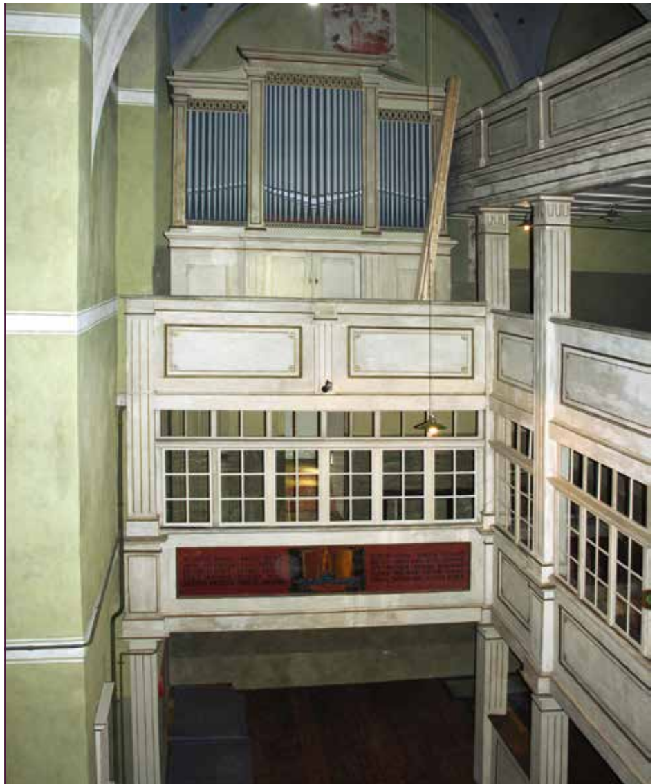
Schlosskapelle Colditz mit Orgel. Die jetzt sichtbaren Orgelpfeifen sind nur eine Attrappe. Bei der Restaurierung der Kapelle wurde anstelle der Prospektpfeifen eine bemalte Leinwand eingesetzt.

Während der Zeit des Zweiten Weltkrieges spielte die Colditzer Schlosskapelle, insbesondere deren Orgel, eine besondere Rolle. In dieser Zeit war Schloss Colditz Gefangenenlager für alliierte Offiziere. Das Oflag IV C galt zwar als ausbruchssicher, den-