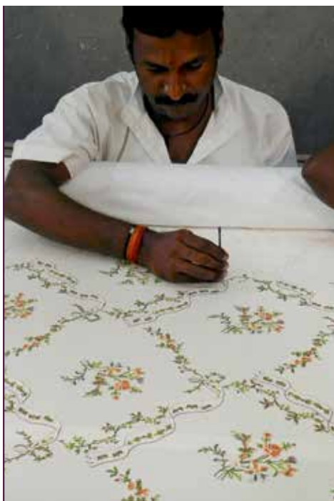
Indischer Sticker bei der Arbeit

letztendlich auf ein historisches Musterstück einer ehemaligen Seidentapete in der Sammlung des Kunstgewerbemuseums der Staatlichen Kunstsammlungen Dresden. Das Seidenripsgewebe wurde fadengetreu von der Seidenweberei Eschke in Crimmitschau rekonstruiert. Schwieriger gestaltete sich die Beschaffung der Stickfäden. Unterschiedliche Fadenstärken und Faden-