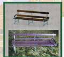
Parkbank nach historischem Vorbild am Schlosstetich