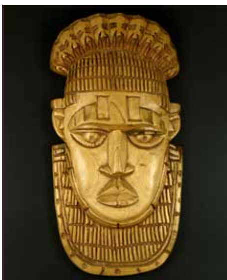
Afrikanische Maske, Geschenk der Premierministerin der Provinz Free State (Südafrika) 2006

Bereits damals wurden diese Geschenke als Sammlung, die einen gewissen Eindruck auf Gäste machen wollte, aufbewahrt. Kunstkammern waren erste Ansätze der späteren Museen und Sammlungen, die heute, wie die Schlösser auch, geschätzte Aufbewahrungsorte der Kunstwerke von beträchtlicher Anziehungskraft sind. Als berühmte Sammler waren Kaiser Rudolf II. in Prag und Friedrich August I. (August der Starke) sowie dessen Sohn Friedrich August II. oder auch Königin Christina von Schweden bekannt. Letztere war eine leidenschaftliche Sammlerin, die es sogar auf die legendäre Sammlung Rudolfs II. in Prag abgesehen hatte und 1648, im letzten Jahr des Dreißigjährigen Krieges, bedeutende Kunstwerke aus Prag nach Schweden transportieren ließ, von denen sie später einen Teil nach Italien mitnahm. Während viele