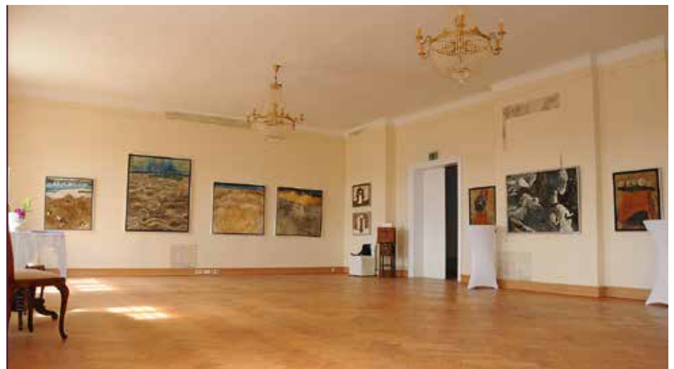
Schloss Struppen, fertiggestellter Veranstaltungssaal

ges und die Beantragung von Fördermitteln zur kompletten Sanierung des Gebäudes einschließlich der Gestaltung der Außenbereiche. Nachdem im April 2016 die Baugenehmigung durch die zuständige Behörde beim Landratsamt Sächsische Schweiz-Osterzgebirge erteilt wurde, richten sich die Aktivitäten des Vereins nunmehr auf die inhaltlich-technische Präzisierung der Entwurfsplanung für die bauliche Entwicklung des Schlosses. Hierzu wurden die einzelnen Maßnahmen in Bauabschnitte, beginnend mit dem zweiten Halbjahr 2016 bis zum Jahr 2020, fixiert. Aufgrund der intensiven Bemühungen des Vereins ist die finanzielle Förderung der Baumaßnahmen auf einem guten Weg. So