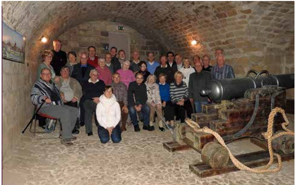
Mitglieder des Dresdner Vereins Brühlsche Terrasse, 2015

Sein 25-jähriges Jubiläum feierte der Verein am 18. Februar 2016 im Festungsmuseum mit einer Ausstellung über das langjährige Wirken der Vereinsmitglieder. Neben Vereinsmitgliedern waren Gäste und Weggefährten vieler Jahre der Einladung gefolgt. Nach einer Begrüßung durch den Vor-