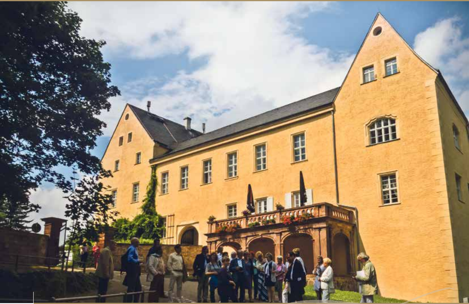
Teilnehmer des 2. Sächsischen Schlässertags vor Schloss Frohburg