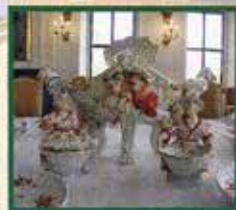
Zwei Chinesenfiguren aus dem Brühl'schen Tafelaufsatz (Neuausformung)