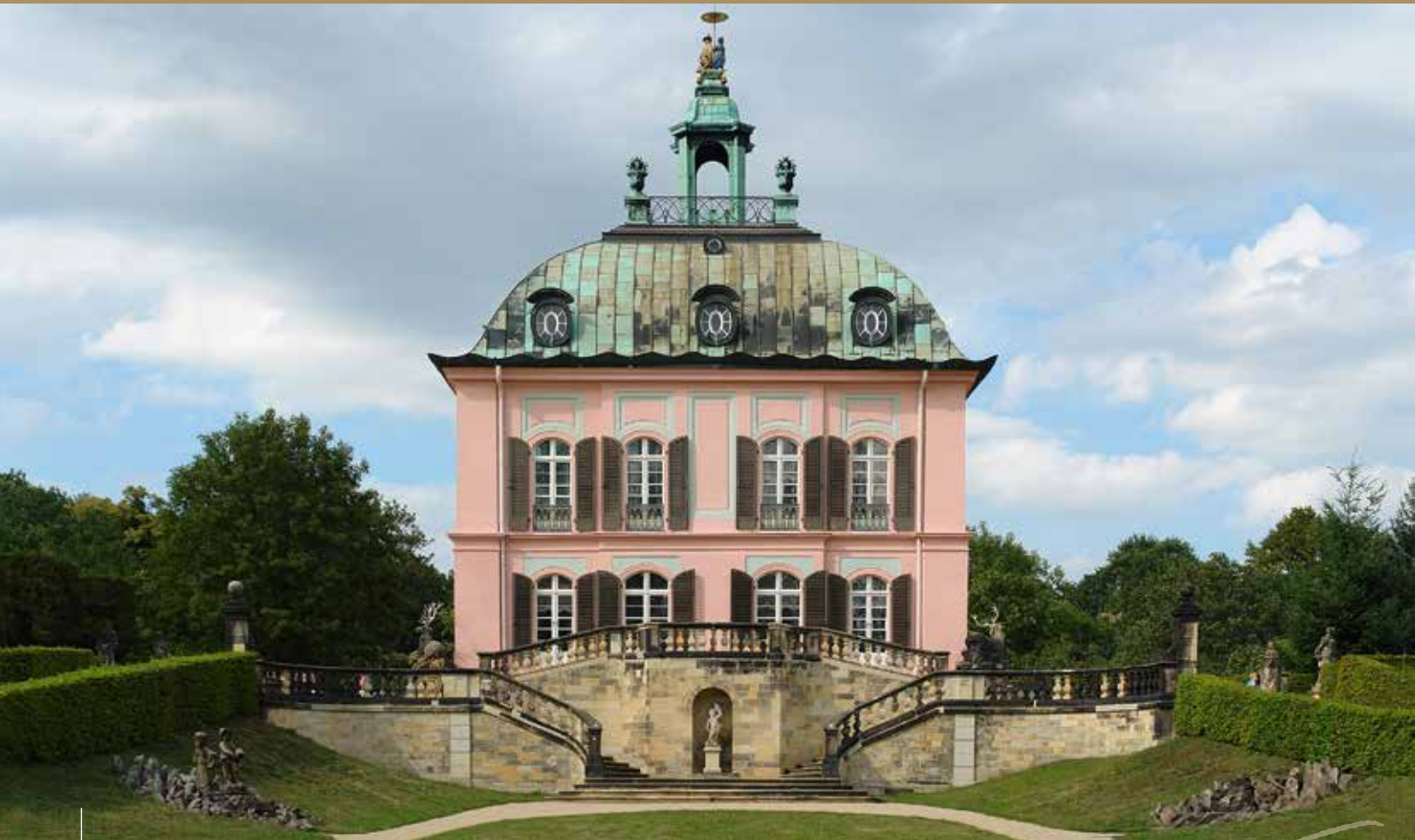
Fasanenschlösschen in Moritzburg