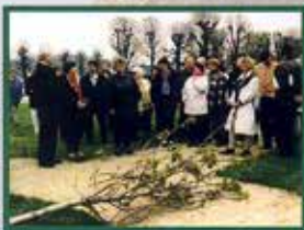
Festerlicher Start der Baumpflanzung im Schlosspark