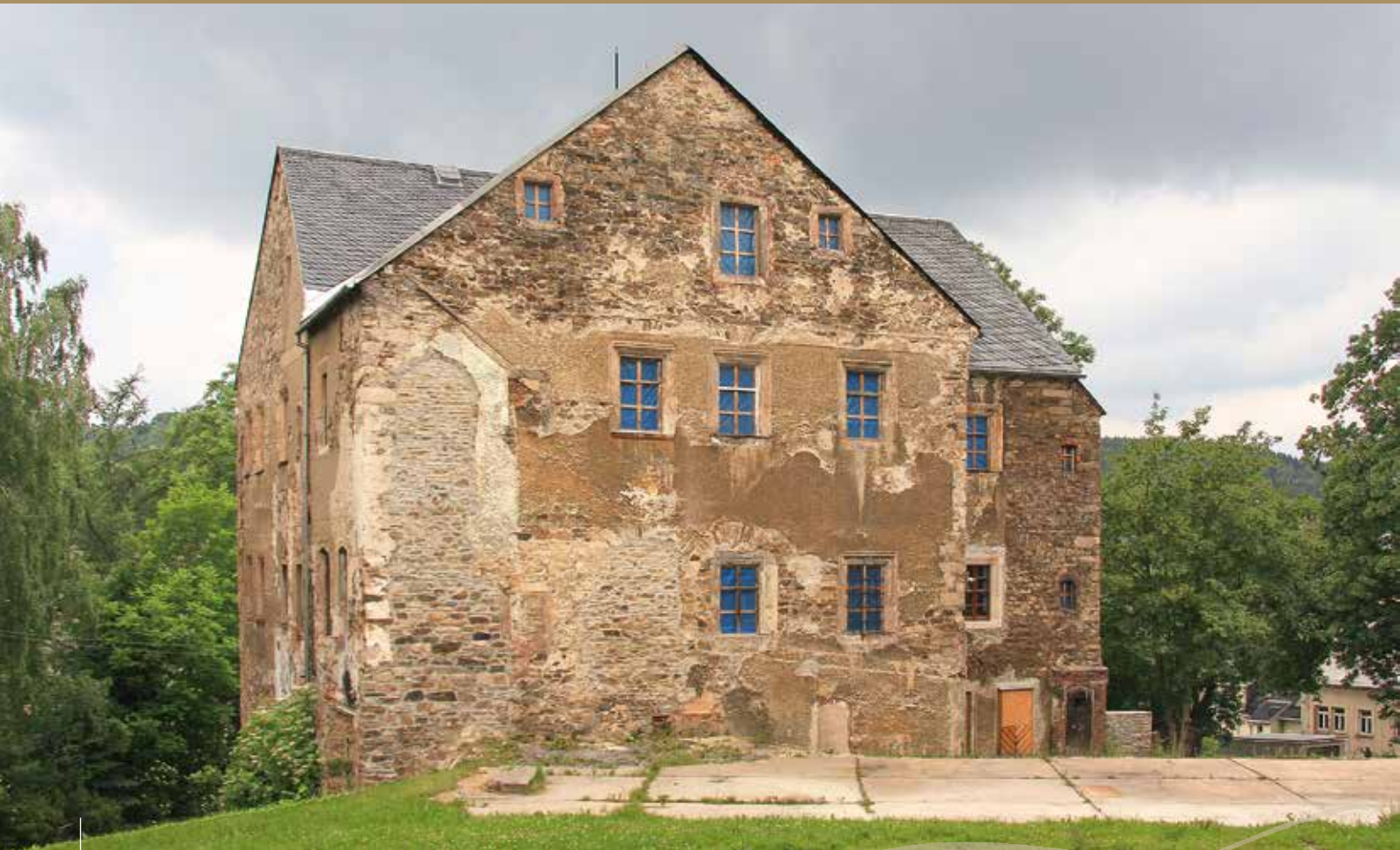
Herrenhaus auf dem Gelände des ehemaligen Rittergutes Geyersberg