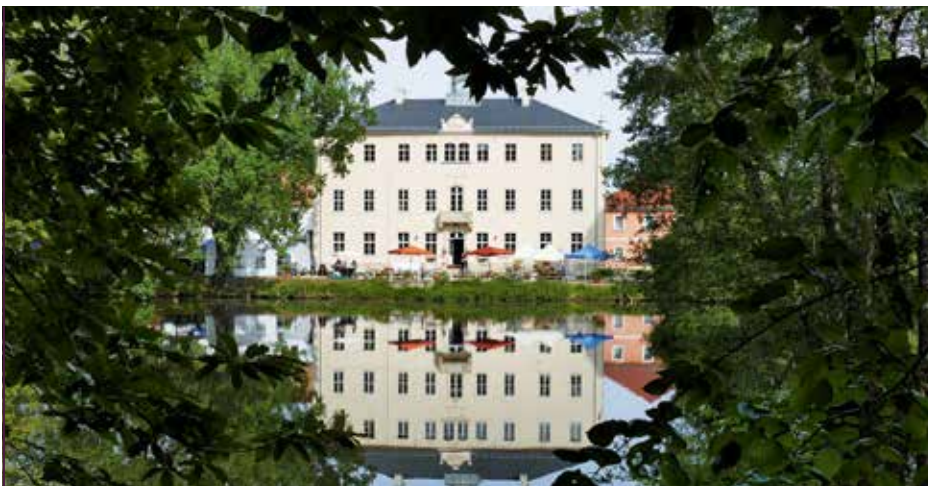
Schloss Lauterbach mit Turm (oben) und der heutige Zustand ohne Turm (unten)

Die Namen der „Turmherren“ werden nach der Fertigstellung in einer Schatulle in der Turmspitze hinterlegt.