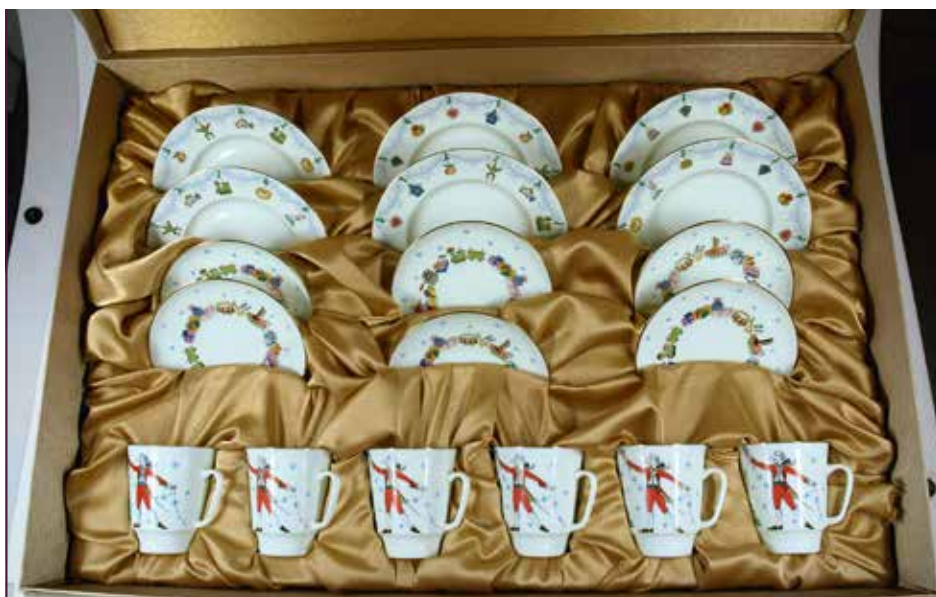
Porzellanservice der Kaiserlichen Porzellanmanufaktur St. Petersburg, Geschenk des russischen Präsidenten Wladimir Putin 2009

sich nach dem Zweiten Weltkrieg das Land Rheinland-Pfalz, das sie 1949/50 von den Erben für das kunstgeschichtliche Institut der Universität Mainz erwarb. Dort bzw. seit 1981 im Landesmuseum Mainz ist sie noch heute vorhanden, sodass wir sie und die Persönlichkeit des fürstlichen Sammlers im nächsten Sommer auf dem Weesenstein vorstellen können.