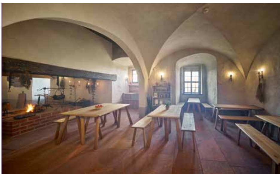
Burg Mildenstein, Rußküche im Herrenhaus

Der umfangreiche Ausbau der Burg Mildenstein als Residenz, Anfang des 15. Jahr-