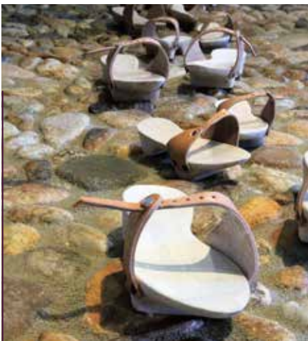
Burg Mildestein, Holzschuhe zum Anprobieren

die im Thüringischen Hauptstaatsarchiv Weimar die Zeit überdauerten, ein anschauliches und authentisches Bild des Alltags der Fürstenkinder zeichnen.