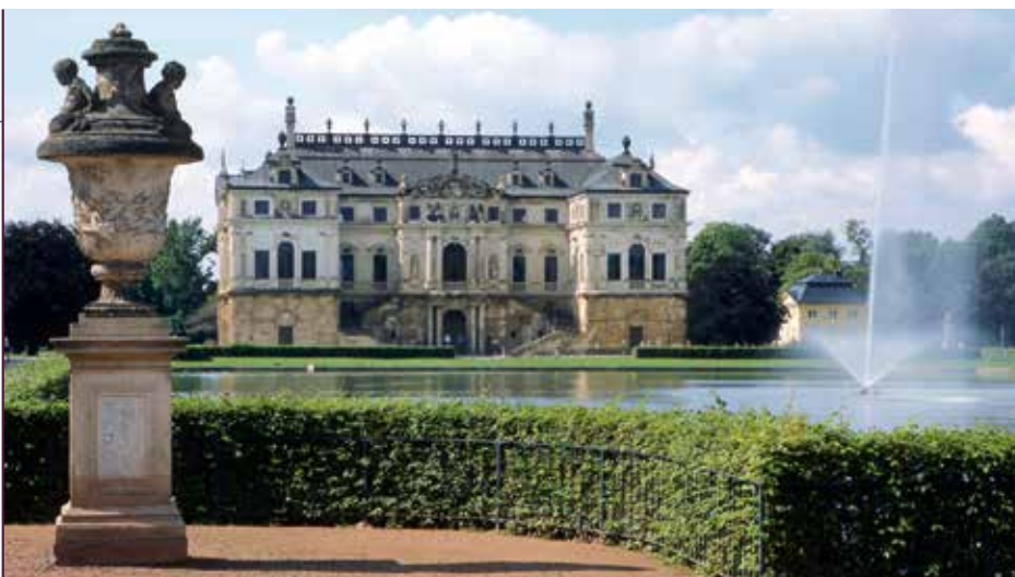
Palais im Großen Garten in Dresden

Im 700. Jubiläumsjahr der urkundlichen Ersterwähnung Weesensteins widmet sich die Sonderausstellung „Bombensicher! Kunstversteck Weesenstein 1945“ einem bislang kaum beachteten Thema der Weesensteiner Schlossgeschichte. Vor allem die wuchtigen Burgräume mit ihren dicken Mauern dienten während des Zweiten Weltkrieges als sichere Unterbringung für unzählige Schätze Dresdener und anderer Sammlungen sowie privater Eigentümer. Bei dieser Führung durch die Sonderausstellung erfahren Sie nicht nur etwas über die spannende Historie dieser Kunstauslagerungen, sondern auch über nicht weniger abenteuerliche Geschichten hinter den Kulissen – wie von dem Weesensteiner Weinlager!