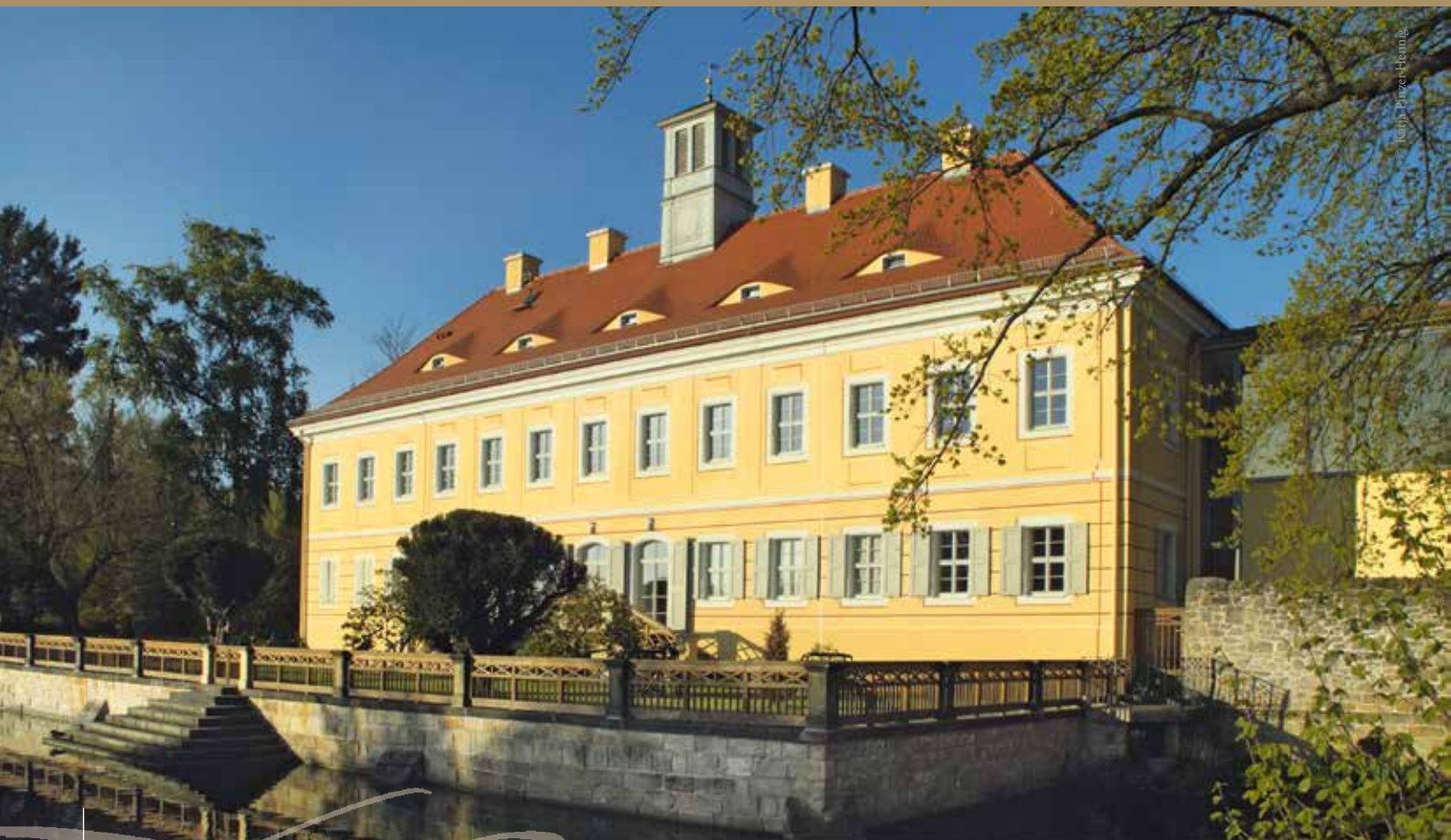
Jagdschloss Raupenberg in Graupa