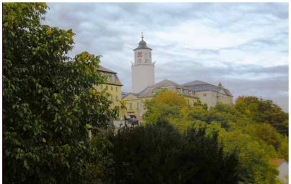
Schloss Crossen in Thüringen kann am 2. September 2018 besichtigt werden.