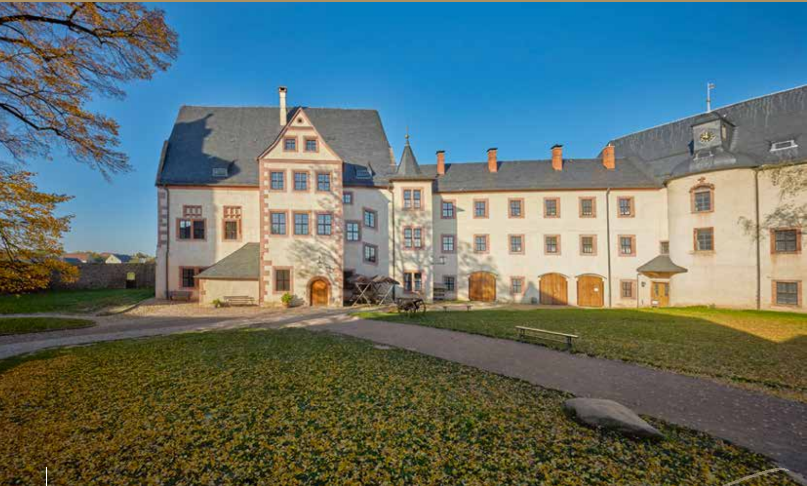
Burg Mildestein, Herrenhaus