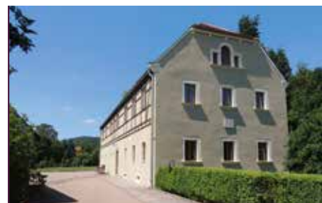
Das Lohengrinhaus in Graupa enthält die authentischen Räume, in denen Richard Wagner einst den Sommer verbrachte.

– während der Dauer eines längeren Urlaubs verweilen will“. Er blieb elf Wochen bis Ende Juli 1846, genoss die Idylle und Ruhe des Ortes, entspannte sich bei seinen vielen Wanderungen, die ihn unter anderem zur Bastei, in den Liebethaler Grund und zum Borsberg führten, und ließ sich von den Schönheiten der Natur inspirieren. So entstand in einem Schaffensrausch der komplette Kompositionsentwurf seiner Oper „Lohengrin“. Noch heute erinnern der Name Lohengrinhaus für das