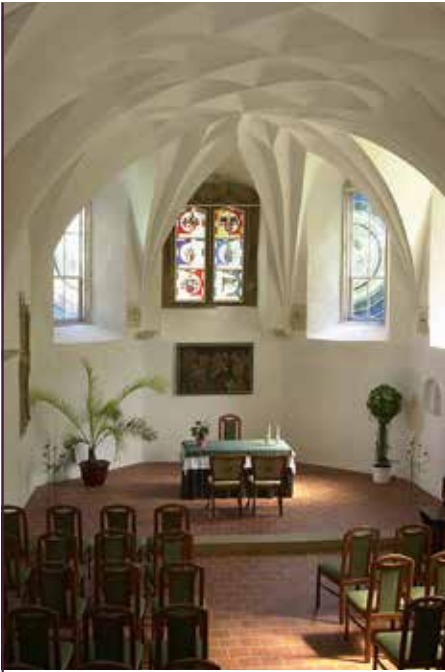
Schloss Schleinitz, Schlosskapelle

nauso diskutiert werden: Wie gelingt es, mit ehrenamtlichen Kräften ein Schlossensemble zu betreiben und für die Öffentlichkeit zugänglich zu machen? Wie können noch mehr Besucher herangeholt werden, die einen wirtschaftlichen Betrieb ermöglichen? Und wie können neue Vereinsmitglieder gewonnen werden?