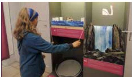
Das interaktive Museum bietet viele Angebote zum Entdecken und Ausprobieren

1755 gelangte die Anlage in den privaten Besitz Friedrich August II. von Sachsen. Er ließ das durch die Renaissance geprägte Bauwerk zu einem Jagdschloss in barocker Gestalt umbauen. Es erhielt den Namen „Raupenberg“. Mit der im selben Jahr begonnenen Pflanzung von Eichen entlang der Parkmauer wurde die Entwicklung zum Landschaftspark eingeleitet.