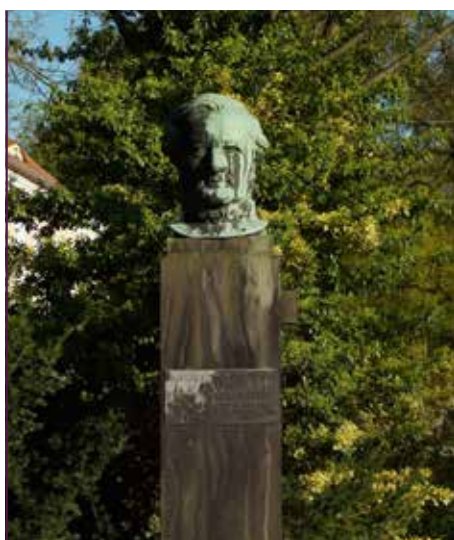
Richard-Wagner-Denkmal am Schloss

Um 1600 entstand auf der Fläche des heutigen Schlossparks ein Wildgehege, das bis 1827 als Tiergarten genutzt wurde. Gäste, zu denen wohl auch die Wettiner zählten, konnten hier ihrer Jagdleidenschaft nachgehen. Bereits während der Zeit der Herren