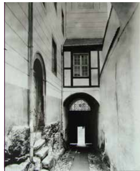
Schloss Weesenstein, Felsengang, um 1940