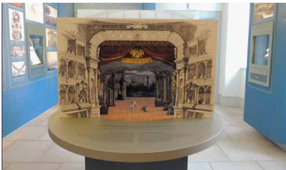
Richard-Wagner-Museum im Jagdschloss Graupa

Das Schloss ist aus dem westlichen Flügel einer Vorwerksanlage hervorgegangen, die mindestens in das 16. Jahrhundert zurückzudatieren ist. Seine heutige Gestalt erhielt es in zwei Etappen. Die Grundgestalt im Renaissance-Stil entstand nach 1659 unter der Ägide der Freiherren von Friesen. Die barocke Überformung folgte ab 1755 durch das sächsische Herrscherhaus der Wettiner. Die urkundliche Ersterwähnung von 1350 als villa Crup (crup = Erdklumpen) verweist auf die weit zurückreichende Geschichte einer dörflichen Ansiedlung oder/und eines Landsitzes im Sinne eines Gutsbesitzes unter der Oberlehnshoheit der Markgrafen von Meißen. Über die Jahrhunderte wandelte sich nicht nur der Name des Ortes (u. a. Cruppen, Krub maior, Krawp, Krawpe, Krauppen, Grauppe, Graupen, Grau-