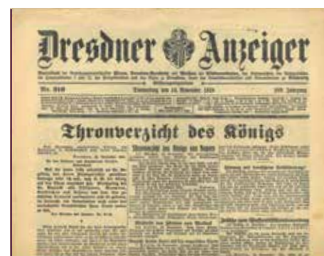
Titelseite des „Dresdner Anzeiger“ vom 14. November 1918 mit der Mitteilung der Abdankung des Königs