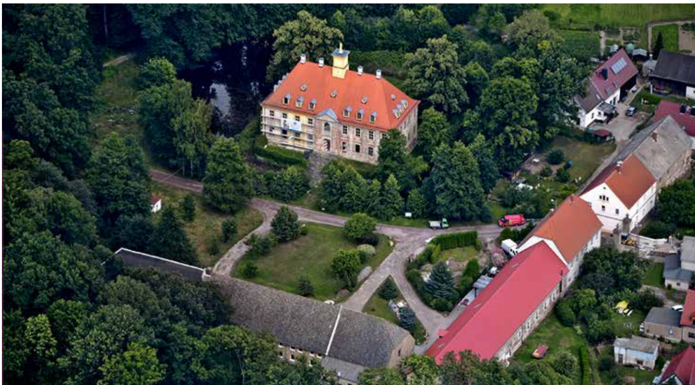
Schloss Leuben, Luftaufnahme

Unzählige Führungen und Veranstaltungen hat das Schloss erlebt, seitdem der Leubener Schlossverein 2004 die Ruine und einen Teil des früheren Guts Hofes erwarb. Zunächst musste der Bau durch ein neues Dach vor dem weiteren Verfall geschützt werden. Dann wurde das Schloss entkernt und damit die Grundlage für einen Innenausbau geschaffen. Im Jahr 2016 setzte sich der Schlossverein bei der MDR-Spielshow „Mach dich ran“ gegen Teams aus Sachsen-Anhalt und Thüringen durch. Er ge-