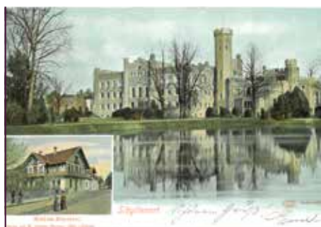
Schloss Sibyllenort, Postkarte, um 1900