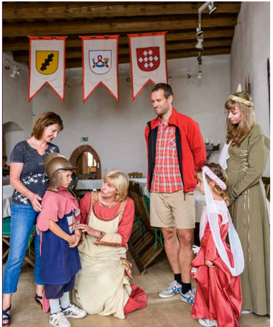
Angebote für Familien auf Burg Mildestein

Doch die schönen Erinnerungen überwiegen. Sie lächelt, wenn sie davon berichtet, was für ein Kraftakt die Leonardo-da-Vinci-Ausstellung bedeutete, die vor ein paar Jahren in die Burg lockte. Gemeinsam haben sie da geschuftet, alle Hindernisse aus dem Weg geräumt. Die Ausstellung war dann ein toller Erfolg. Zinnng! Oder die Aufführungen im Burgtheater auf dem Hof, ein museumspädagogisches Projekt mit dem Theater Döbeln von und mit Schülern. Zinnng! Und nicht zuletzt das internationale Filmprojekt „Die Gräfin“ von Julie Delpy mit Daniel Brühl und William Hurt. Gedreht in der Burg Mildestein und