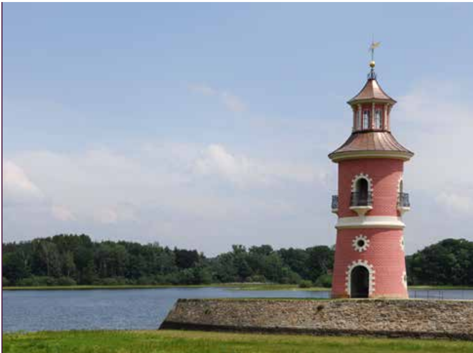
Ein Sehnsuchtsort: der einzige sächsische Leuchtturm in der Nähe des Fasanenschlösschens Moritzburg