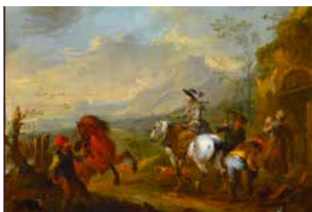
Johann August Querfurt, Reiterrast vor einer Hütte in Ruinen, vor 1741, Öl auf Kupfer