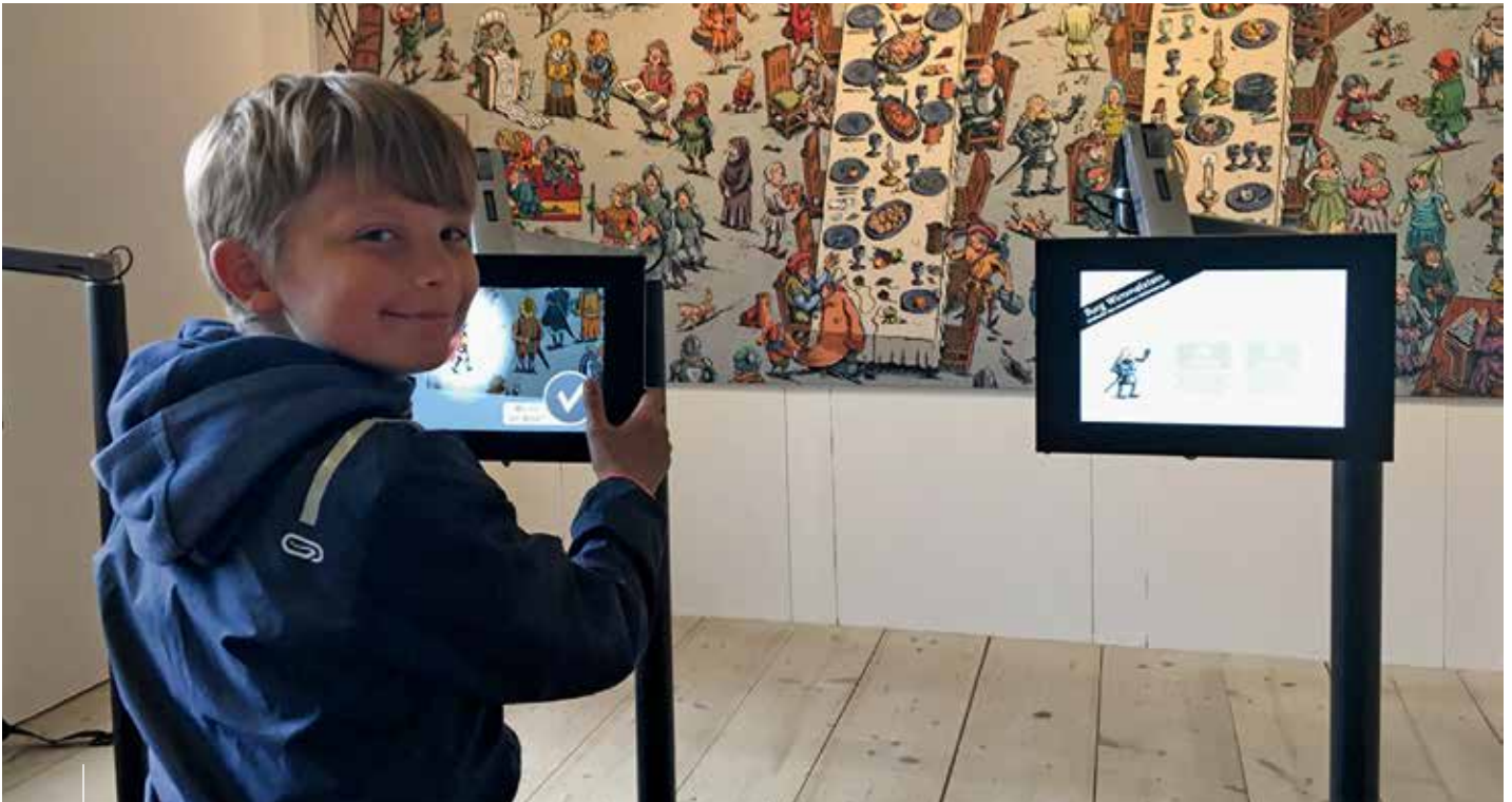
Burg Mildestein, Wimmelstein-App für Kinder