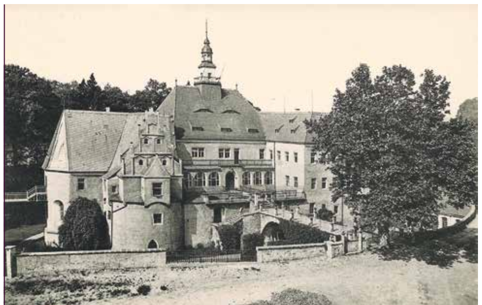
Schloss Schleinitz, Ansicht, um 1910

E-Mail: foerderverein@schlossschleinitz.de