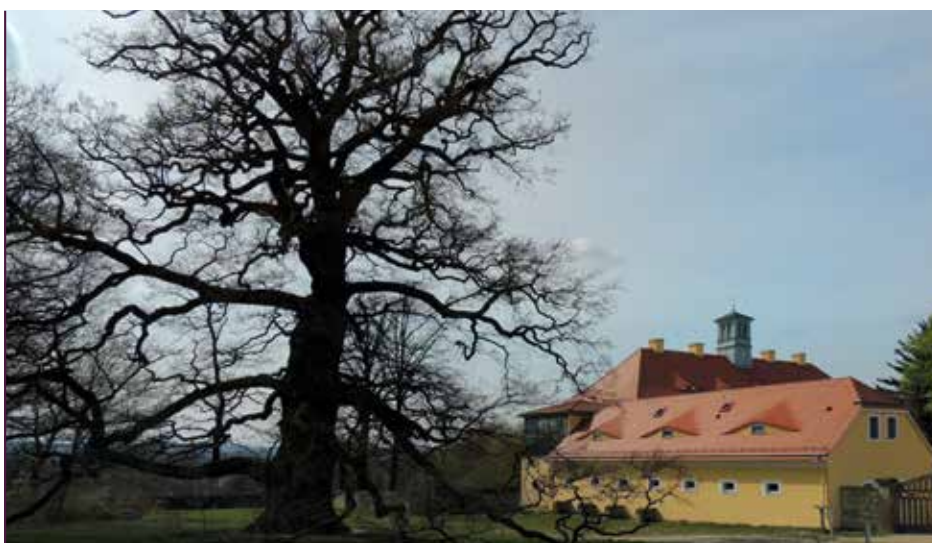
Alte Eiche neben dem Jagdschloss Graupa