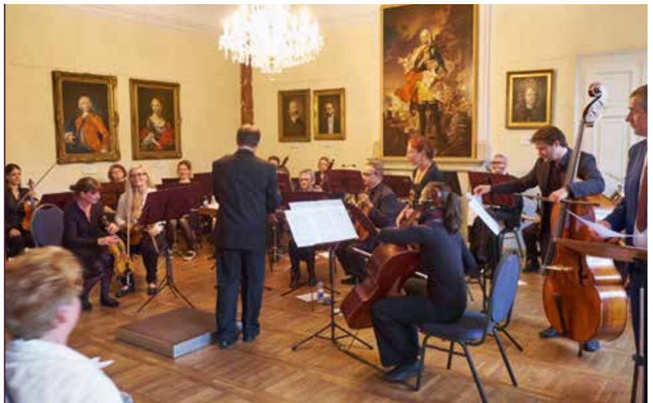
Konzert im Schloss Lauterbach

Voranmeldung unter Tel. 035973 23410 oder stolpen@schloesserland-sachsen.de