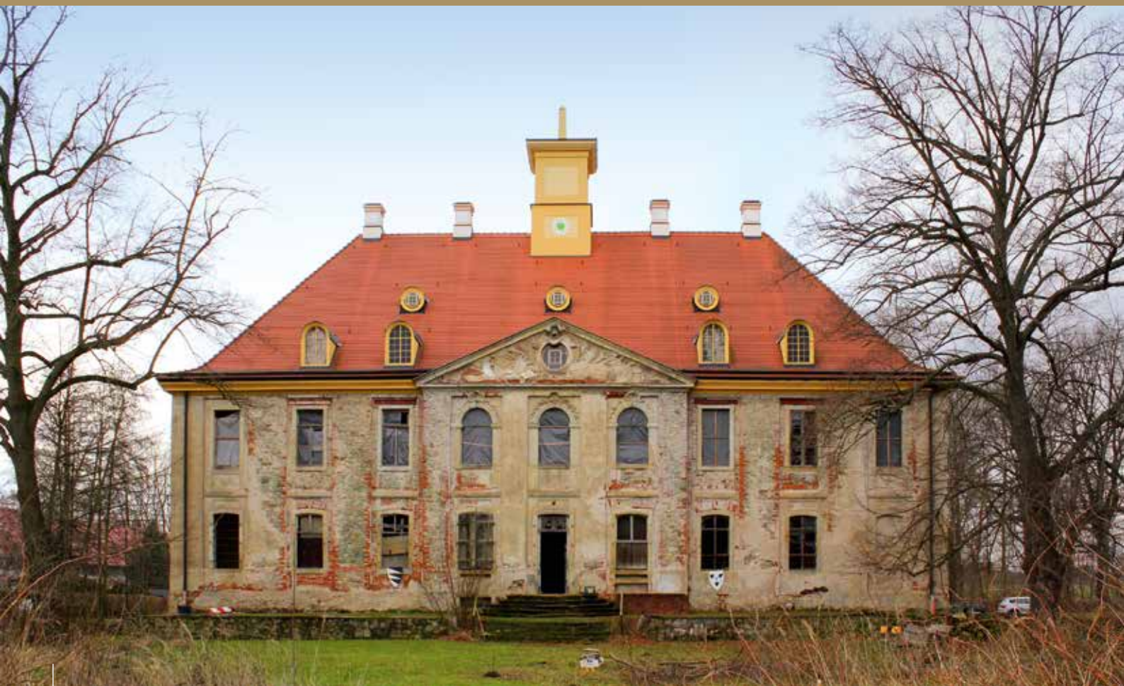
Gartenseite des Schlosses Leuben mit neu aufgesetztem Dach, aber noch unsanierter Fassade