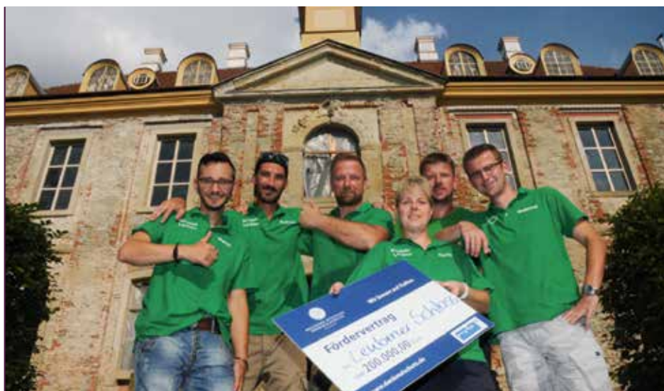
Der Leubener Schlossverein gewann bei der MDR-Show „Mach dich ran“ 200.000 Euro.