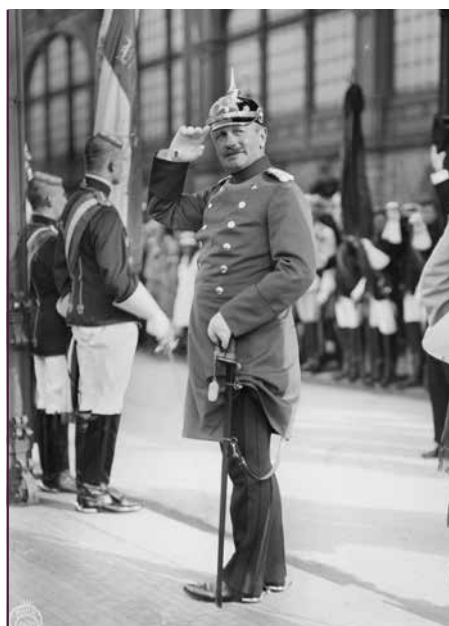
König Friedrich August III., vor 1914