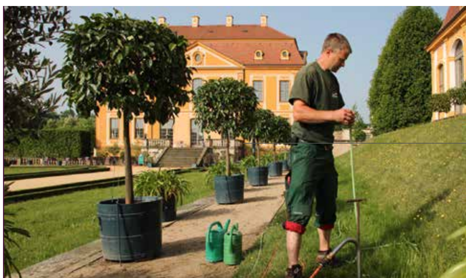
Parkpflege im Barockgarten Großsedlitz

Voranmeldung unter Tel. 03521 47070 oder albrechtsburg@schloesserland-sachsen.de