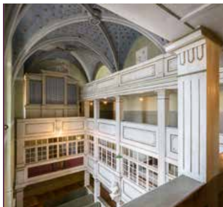
Blick auf die Orgel in der Colditzer Schlosskapelle

Das Display wird alle 792 Pfeifenbezeichnungen enthalten. Es lässt sich erkennen, wer gespendet hat, denn der Name der Orgelpfeife wird mit dem Namen des Spenders gekennzeichnet. So füllt sich idealerweise die Wand mit Namen aus vieler Herren Länder und wird von sich aus immer werbewirksamer sein. Zwingend einfach und leicht verständlich werden die wenigen Schritte bis zur Patenschaft erkennbar sein, denn der Besucher hält sich nur wenige Minuten hier auf und in dieser Zeit muss der Entschluss zur Spende entfacht sein. Damit wäre nach zwei Jahren endlich ein deutlicher Spendenaufruf installiert, der hoffentlich das Projekt starten lässt.