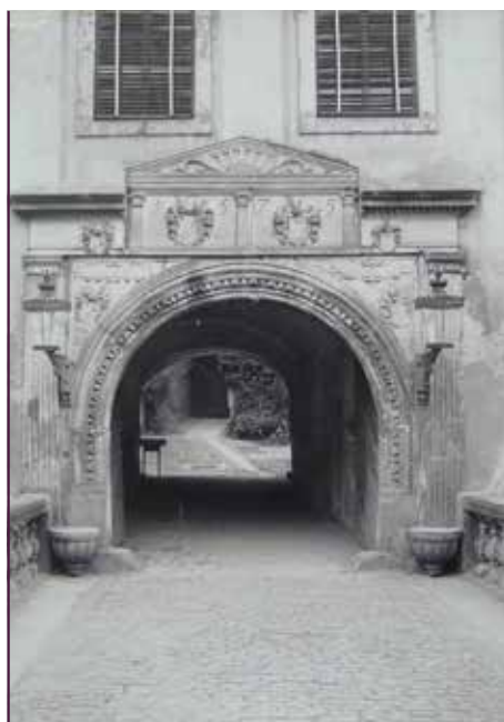
Schloss Weesenstein, Tor, um 1940

Der Stempel „GEHEIM“ prangt auf fast allen, zahlreich vorhandenen Unterlagen, die das Hauptdepot Weesenstein betreffen: Ab dem Jahr 1942 beherbergte das Schloss im Müglitztal als sogenanntes Großdepot ausgelagerte Kunstschätze – vor allem aus Dresden. Das von der Landeshauptstadt gut erreichbare, geräumige Ensemble geriet ins Visier Dresdener Museumsdirektoren, als im Verlauf des Zweiten Weltkriegs fieberhaft Orte außerhalb der von Bombardements bedrohten Städ-