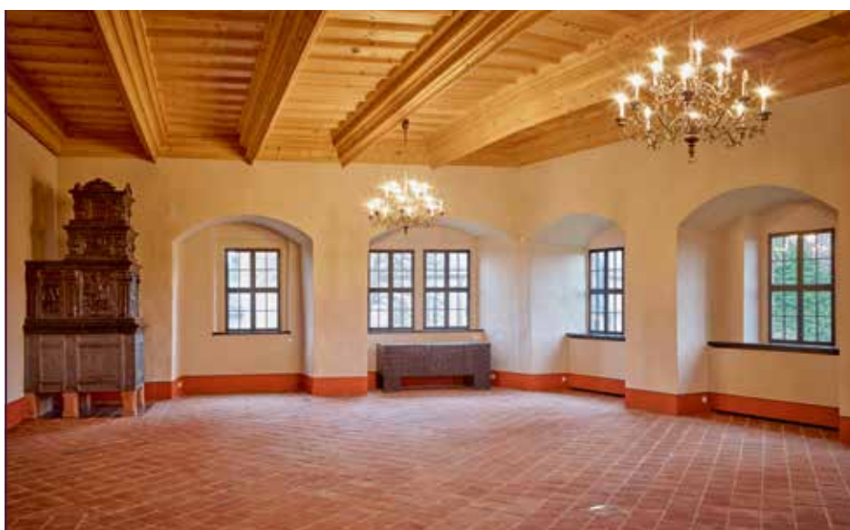
Burg Mildenstein, Fürstenstube im Herrenhaus

hunderts, ist auf Markgraf Wilhelm I. den Einäugigen zurückzuführen. Er plante offensichtlich, die Fürstenfamilie mehrmals im Jahr hier Hof halten zu lassen. Doch dazu kam es nie. Vielmehr wurden Leisnig und damit auch die Burg Mildenstein Mitte des 15. Jahrhunderts zur Kinderstube der kurfürstlichen Familie. Vor allem die acht Kinder von Kurfürst Friedrich II. dem Sanftmütigen und seiner Frau Margaretha von Österreich verbrachten ab 1437 längere Aufenthalte auf der Burg.